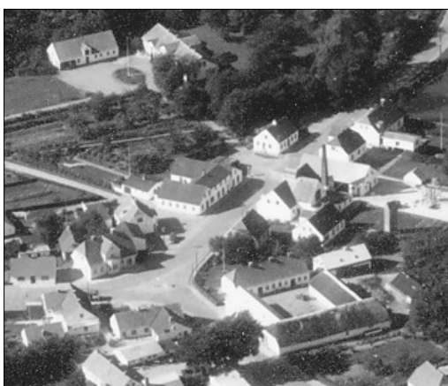
Før pakhuset blev bygget 1956

I efteråret 1946 var der planer om kloakering i Øster Hornum. Det fik Brugsens bestyrelse til at få en landmåler til at fastlægge skellet over til præstegården. Det blev vedtaget at gå med i kloakeringsprojektet med et bidrag på knap 3000 kr. – et beløb der voksede til 3500 kr. efter kloakeringen var udført.