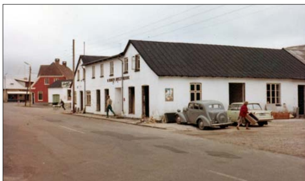
Den gamle brugs rives ned

I perioden efter den gamle Brugs var lukket og til den ny Brugs var bygget og klar til indvielse måtte salget foregå fra en del af lageret. Det var knebent med plads og meget svært for kunder og personale at få tingene til at fungere på en fornuftig måde, men man kæmpede sig igennem perioden fra begyndelsen af juni til midt i november, hvor den ny butik stod klar.