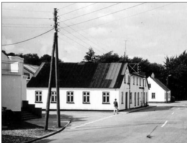
Brugsen ca. 1960