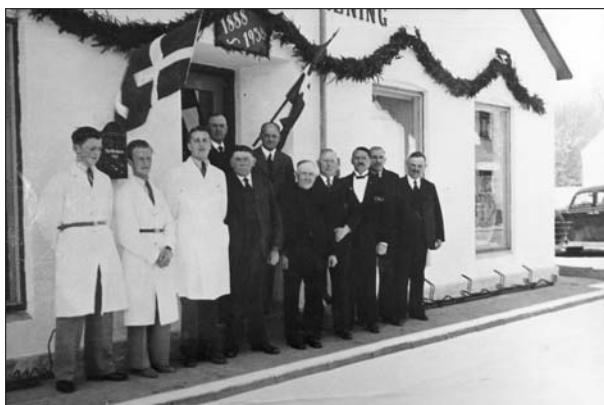
Ansatte og bestyrelse på jubilæumsdagen 1938

Allerede i efteråret 1933 byggedes et nyt pakhuis. I 1934 meldtes om stigende omsætning og i 1935 indlagdes vand fra det nyetablerede vandværk i byen. Op gennem 1930'erne fortsatte den økonomiske optur for foreningen og bestyrelsen puslede med tanker om en gennemgribende ombygning og modernisering af butikken. Man indkaldte en arkitekt fra FDB, men planerne faldt med et brag på generalforsamlingen. Bestyrelsen blev bemyndiget til at foretage de nødvendige reparationer og der lappedes videre på de gamle bygninger med udrapning og kalkning af murene, lapning af tjæretaget og maling af døre og vinduer.