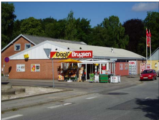
Daglig' Brugsen 2004