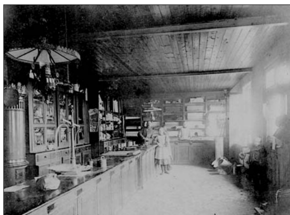
... og her indefra