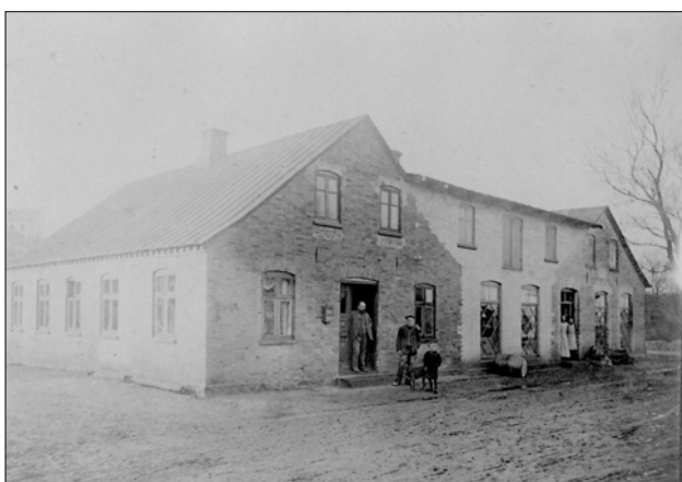
Brugsen lige efter udvidelsen, her set udefra

Da brugsforeningen byggede i 1889 troede alle, at omsætningen vanskeligt ville nå en årlig omsætning af 30.000 kr. Men omsætningen kom snart til at overstige dette beløb, og huset blev for lille. Allerede 1896 måtte butikken ombygges, således at indgangen blev på sydsiden af huset. Noget af beboelsen toges med til butikken. Dette gav nogen plads for en tid, men pladsen var stadig for lille. Det gik nu en halv snes år, men i slutningen af 1906 toges spørgsmålet om mere plads under alvorlig overvejelse. På generalforsamlingen i september gaves bestyrelsen pålæg om at søge forhandling med samlingshuset for om muligt at købe dette. Det var omtrent den eneste udvej til at få plads. I oktober rettedes henvendelse til bestyrelsen for samlingshuset, og dennes svar kom i slutningen af november. De ville sælge og forlangte 3200 kr. for samlingshuset. Brugsforeningen holdt generalforsamling den 10. december, og på denne vedtoges med 59 ja mod 21 nej at købe samlingshuset til nævnte pris. Allerede den 17. december holdtes igen generalforsamling, og på denne forelå to forslag. Det første gik ud på at sammenbygge begge huse og det andet på at lave butik i samlingshuset. Det første vedtoges og samme sommer udførtes arbejdet. Det blev særdeles rimelige lokaler, og der er nu ingen frygt for, at de igen skal blive for små.