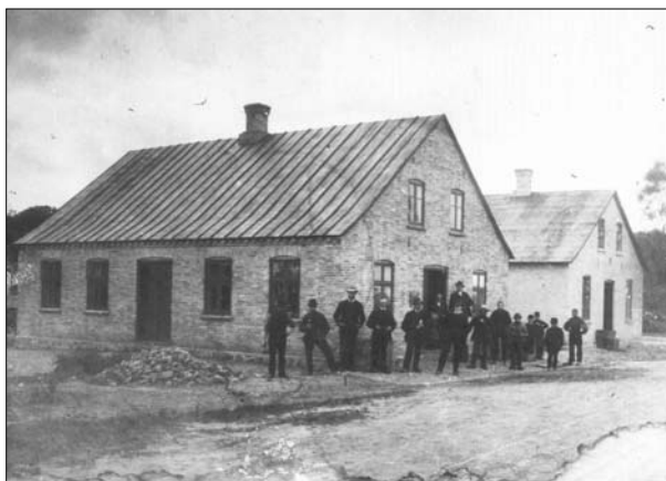
Den nybyggede Øster Hornum Brugsforening