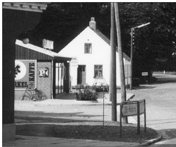
Brugsen efter ombygningen i 1964

I perioden efter den gamle Brugs var lukket og til den ny Brugs var bygget og klar til indvielse måtte salget foregå fra en del af lageret. Det var knebent med plads og meget svært for kunder og personale at få tingene til at fungere på en fornuftig måde, men man kæmpede sig igennem perioden fra begyndelsen af juni til midt i november, hvor den ny butik stod klar.