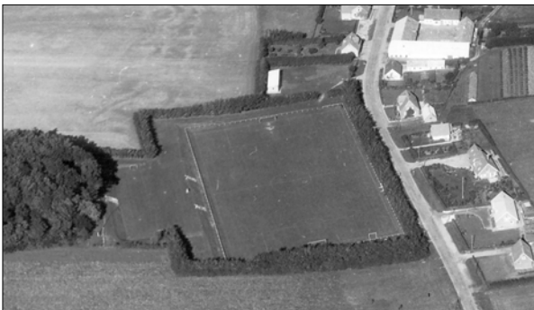
Stadion set fra oven, 1955

ØHI arbejdede videre med de daglige ting. Nye ting blev af og til forsøgt. Badminton fx, men det var i begyndelsen svært at få ørenlyd for denne sport i ØHI. Derfor startede vi en speciel badmintonklub. Jeg husker formålsparagraffen, der indeholdt bestemmelse om, at klubben skulle arbejde for at få en tennisbane. Forhandlingsprotokollen er væk. Så gik igen en halv snes år. Citat fra et møde den 26. februar 1965: ”Efter nogen diskussion vedtog man at etablere en 25-øresklub på den måde, at man tegnede sig for 25 øre pr. mål, som serie 4 fodboldholdet laver i turneringskampe. Pengene skal bruges til lysanlæg på stadion”. En morsomhed fra et møde i den 9 mand store bestyrelse i 1966: ”Alle medlemmerne mødte op ...” Det var nok ikke det almindelige. Om det var 25-øresklubben, der gav resultat, kan jeg ikke sige, men i 1968 blev serie 4 kredsvinder, og man besluttede at købe et lysanlæg i Svenstrup for 300 kr. Det kunne ikke ses helt til Støvring, som det der nu er sat op. I 1969 fik man tilbud på et nyt lysanlæg. Pris ca. 23.000 kr. Man fik hertil et tilskud på 10.000 kr.