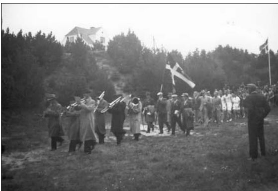
Optoget startede i Sandgraven