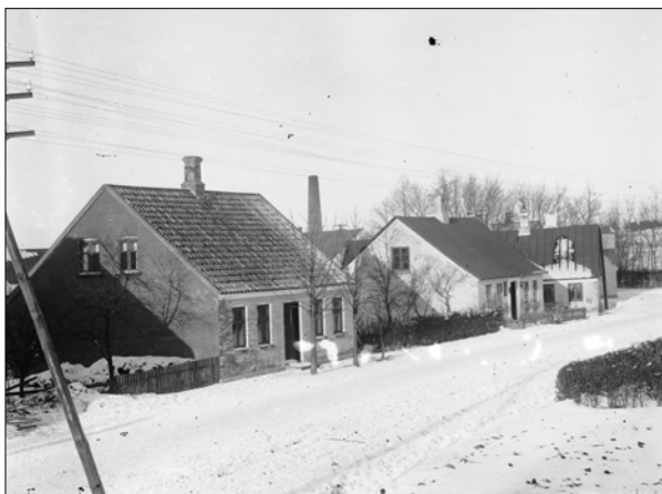
Bygaden, hvor der blev spillet fodbold

Min første erindring om fodbold er knyttet til Sandgraven. Det vil jeg tro gælder de fleste, der var drenge på den tid. Vi tumlede i de to ”gryder”, der var plantet i den gamle losseplads. Selv i skolens gymnastiktime gik læreren med os derop. Legepladsen ved skolen var endnu ikke planeret, idet der på nordsiden af skolen var kridtgrav og på sydsiden masser af vinduer.