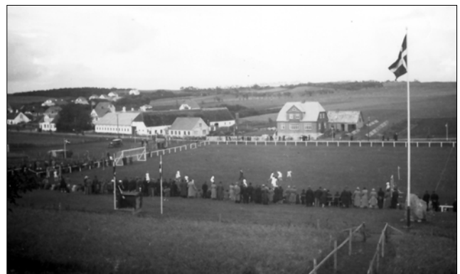
Der blev spillet indivielsekamp i silende regn