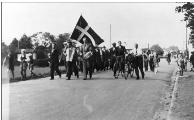
Optog ved indvielsen af håndboldbanen

Derimod var jeg fingrene i et par "Gøglervogne". De var blevet moderne i radioen. Vidt og bredt samledes fulde huse, når der blev arrangeret "Gøglervogn". Også i Øster Hornum kom der mange. Vi var ikke så forvente. Fjernsynet havde ikke skruet vore forventninger op. En båndoptagelse fra den tid siger noget om standarden - og det var ikke lige godt alt sammen. Præmiewhist var også på mode - med fulde huse.