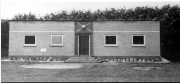
Det ny klubhus