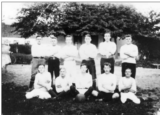
Fodboldholdet 1915 foran Varehuset

Vi må så tænke på de mennesker, der boede i landsbyen og omegnen og deres behov og muligheder. I selve byen var der en hel flok unge mennesker beskæftiget. Alene brugsforening og mejeri tegnede sig for en flok. Håndværkerne og gårdene havde også mange i deres brød. Dertil kom de mange ved landbruget i øvrigt uden for byen. Men arbejdsdagen var lang, så i sommerhalvåret var der ikke det store behov for beskæftigelse efter arbejdstid. Lad os se lidt nærmere på dette forhold. Mejeristerne, der begyndte tidligst om morgenen, gik hjem sidst på eftermiddagen, omklædte og med slips, men måtte tidlig i seng om aftenen for at få udhvilet til næste dag. Brugsen havde åben til kl. 18 i de fire første dage, kl. 19 om fredagen, samt til kl. 20-21 om lørdagen, hvorefter butikken skulle gøres ren og hylderne fyldes op. Såvel på mejeri som i brugs kom dertil "regnetimer", når afregning og tilgodehavender skulle gøres op. Håndværkerne arbejdede hver dag til kl. 18 - også lørdag. Piger og karle på gårdene var slet ikke færdige til at gå i "byen" så tidligt på aftenen. Der foresvæver mig noget om aftenmalkning for pigerne og fodring af heste (kl. 21). Disse arbejdsforhold gjorde, at behovet for fritidsbeskæftigelse ikke var et problem. Dertil kom, at børnene som regel gik i skole til de var 14 år, og derefter kom ud for at tjene. Der var arbejde nok. Længere skolegang? Joh, lærerens og præstens børn skulle måske "læse videre", men den altovervejende flok kom ud på arbejdsmarkedet.