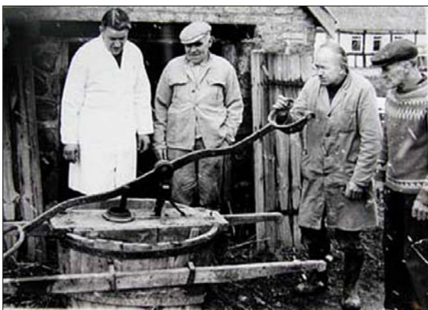
Brandsprøjten var af denne type