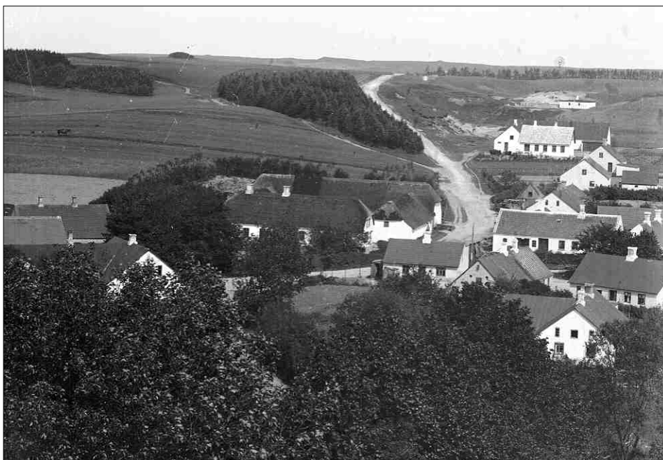
Byen set fra kirketårnet 15 til 25 år efter branden

Det blev en voldsom travl tid for egnens håndværkere, så Brugsen fik ikke bygget så hurtigt som planlagt. Præstegården og ny huse til de husvilde stod først for tur, men sidst på året var det dog lykkedes at få Brugsen bygget færdig, så handelen kunne genoptages, og nu i egne lokaler. I samme omgang byggedes forsamlingshuset som en tvilling til Brugsen.