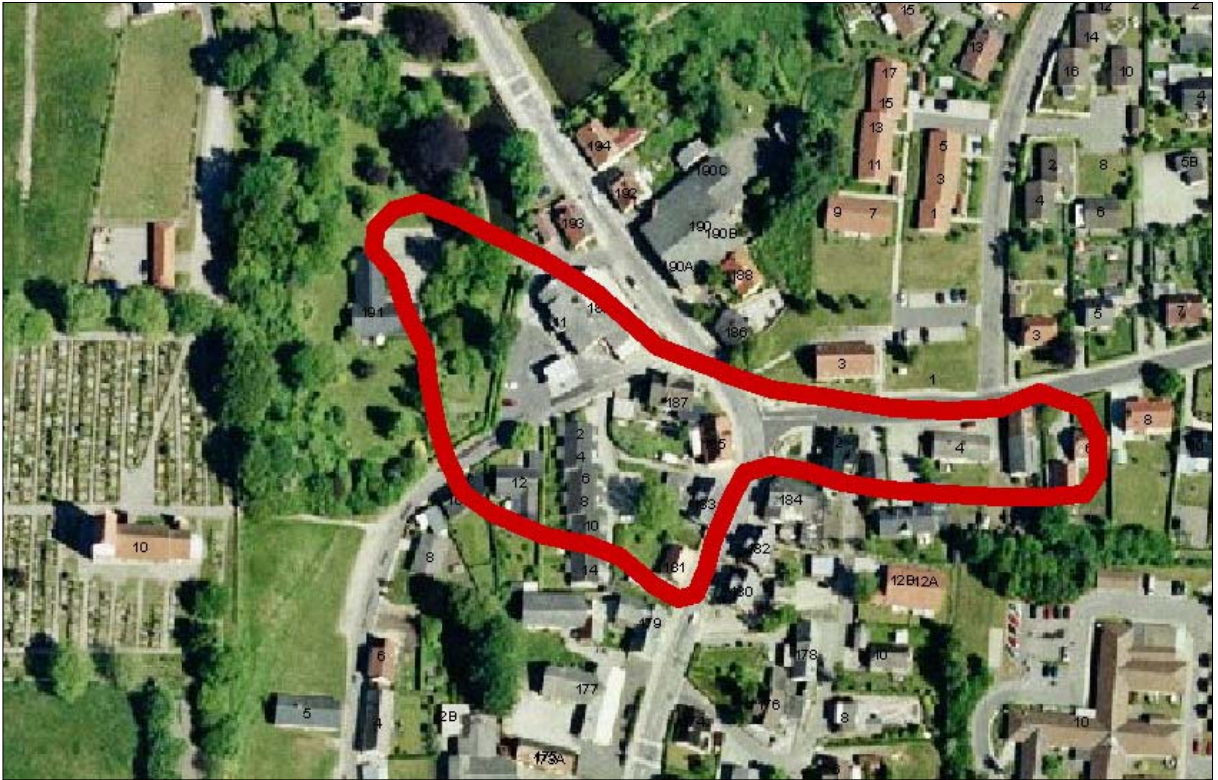
Det indrammede område var den del af byen, der nedbrændte