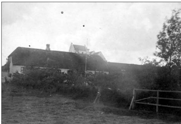
Skolen i begyndelsen af 1890'erne