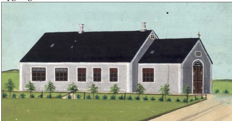
Tegning af Molbjerg Missionshus