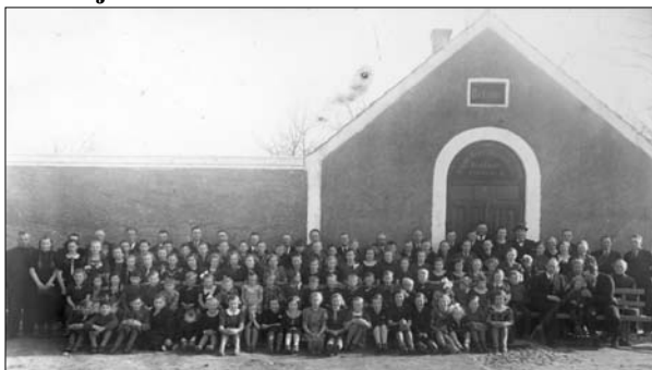
Søndagsskolebørn og andre med tilknytning til Molbjerg missionshus 1939