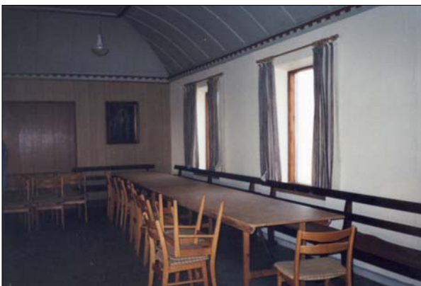
Da der blev lukket og slukket 2003

De kunne bygge det, og de kunne også fylde det med folk igennem mange år. Vi, der er oldebørn af dem, har ikke formået at holde det i gang. Vi kan måske nok undskylde det med at tiden er en anden i dag. Men det skyldes nok især at vi ikke har den kraft og styrke som vore forfædre havde.