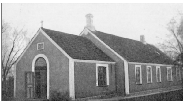
Molbjerg missionshus en gang i 1920'erne

fælles hjælp har forestået husets værtspligter, og lejligheden er efterhånden lavet om til køkken, toilet og garderobe. Det skete i forbindelse med at husets indgang i 1990 blev flyttet til denne ende af huset.