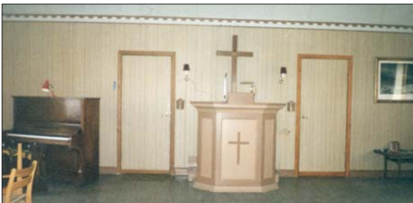
Inventar i Molbjerg Missionshus 2003

Efterhånden døde de ældre mennesker og vi var ikke så mange tilbage til at drive missionshuset videre. Det var jo også blevet ældre og trængte til en renovering. Vi besluttede derfor at sælge det, og det blev solgt til privat bolig i 2003. Det var en svær beslutning at tage, men vi følte ikke rigtig at vi magtede at føre det videre.