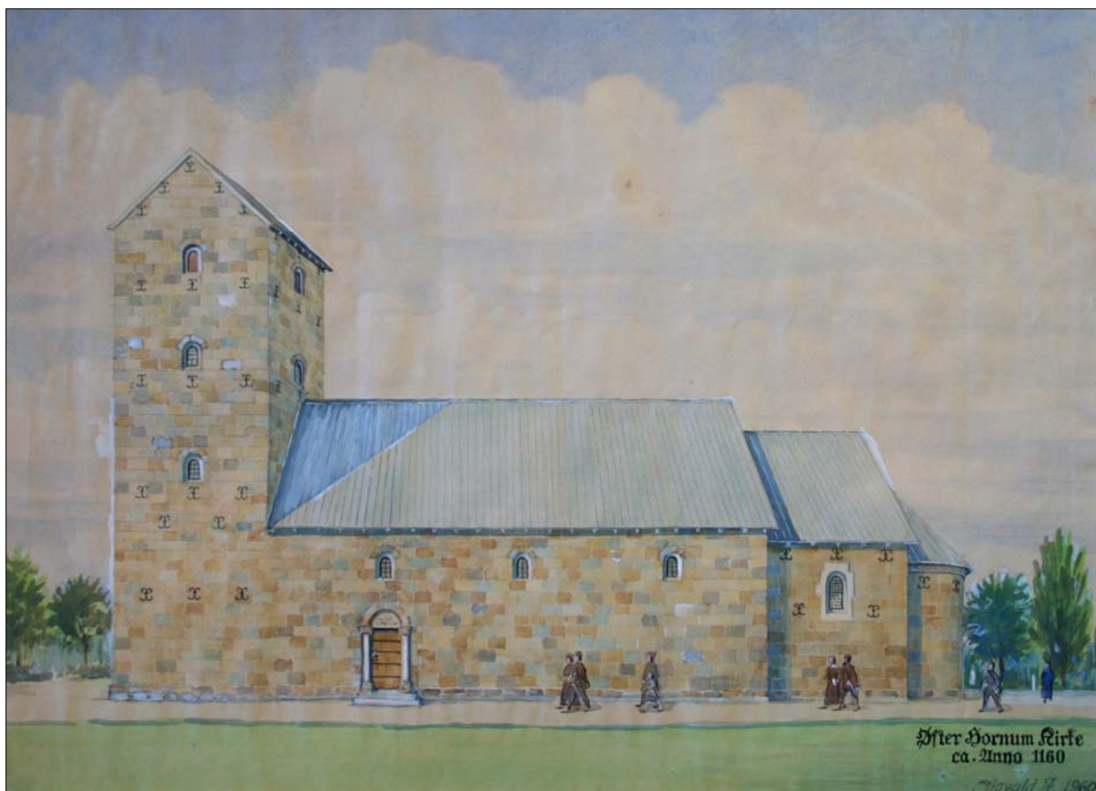
Øster Hornum kirke, som den muligvis så ud, da løbedegnene skar i pulten

Hvad mon i grunden præsten har tænkt, når han fra sin prædikestol næppe har kunnet undgå at lægge mærke til sine degnes specielle form for husflid?