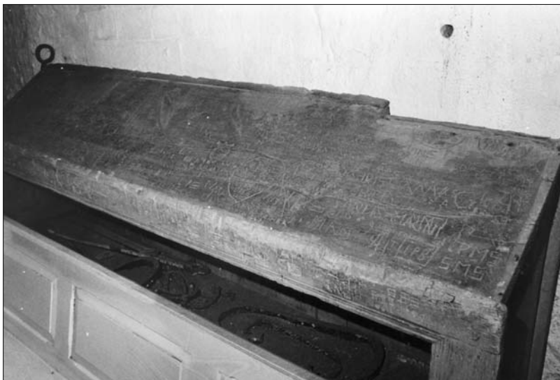
Degnepulten i Øster Hornum kirke

Hvis man kommer på besøg i en seværdighed, eksempelvis op i et kirketårn, så ser man ofte, at andre besøgende har haft blyanten fremme for at skrive deres navn på bjælker eller sten.