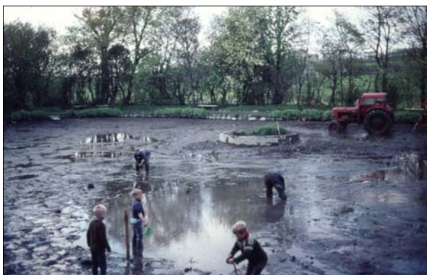
Svanedammen midt i 1960'erne. Her løbes dog ikke på skøjter. Dammen mudres op – og der fanges ål!