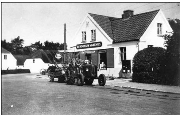
Øster Hornum Varehus, 1949