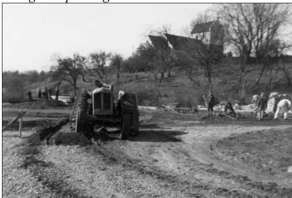
Den gamle præstegård blev jævnet med jorden i 1963