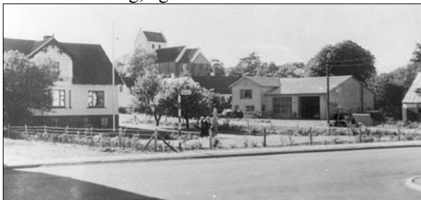
Autoværkstedet til højre