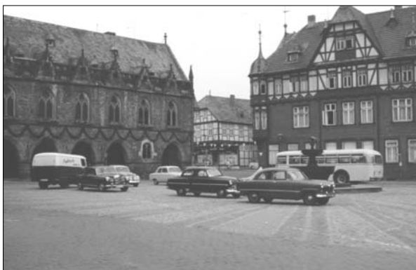
Torvet i Goslar 1958

råde, som lå meget lavt, og så vidt jeg husker, var det heldigt de havde luftmadrasser at sove på.