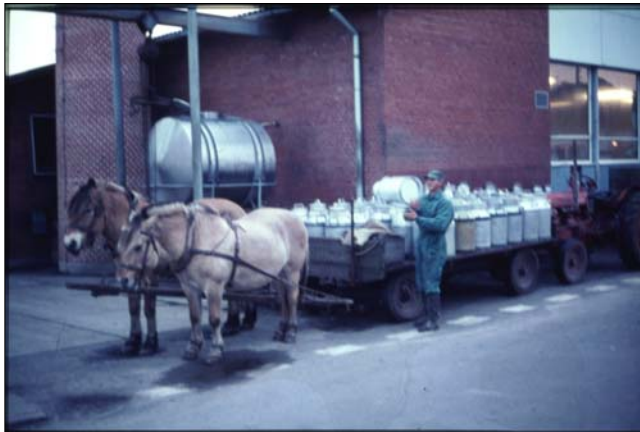
En af de sidste hestetrukne mejerivogne foran det ny mejeri

Det var inden mejeriet blev udstyret med tankvogne, og i mange år var det far, der sammen med en af mejeristerne stod for indvejningen. Jeg kan ganske svagt huske, at der blev fremstillet ost på mejeriet, men i mange år var det tilvirkning af smør, som var den vigtigste del af produktionen.