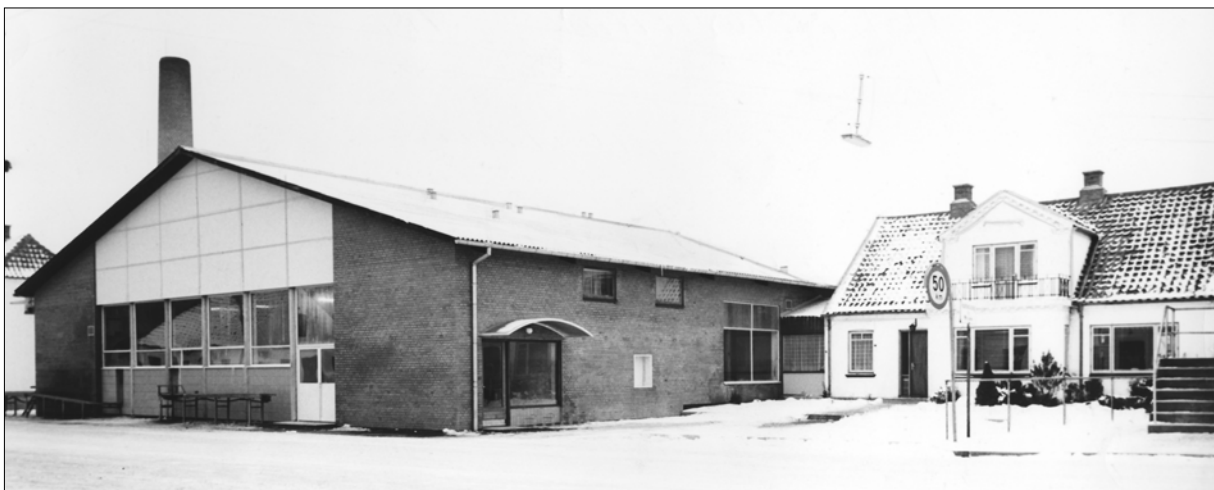
Mejeriet fra 1962 – til højre mejeribestyrerboligen fra 1903