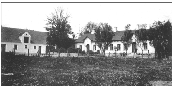
Den gamle præstegård