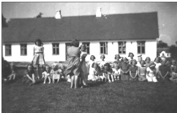
Frikvarter ved den gamle skole i Øster Hornum