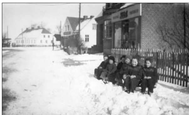
Børn foran Tatol, ca. 1950