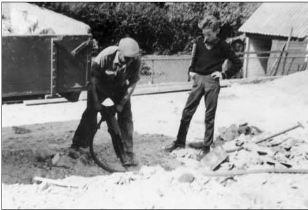
Der arbejdes med tryklufthammer