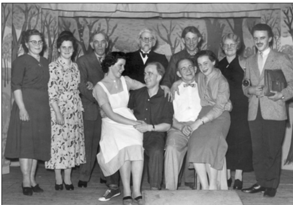
Dilettantforestilling i forsamlingshuset 1960