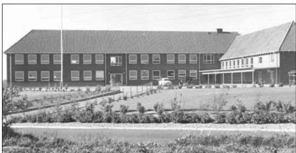
Den nye skole i Øster Hornum