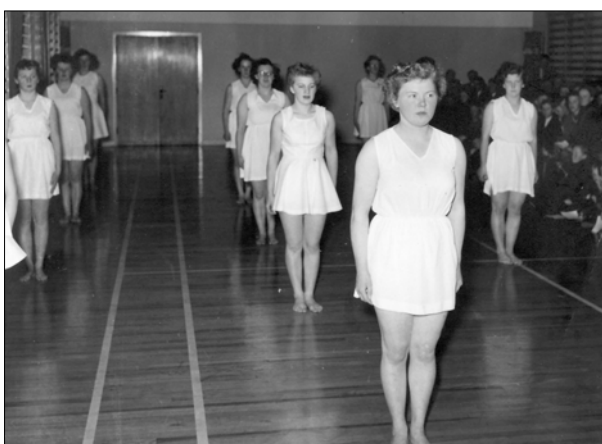
Gymnastikopvisning i skolens gymnastiksal 1960

stede, så det var en stor dag, da åbningen fandt sted. Stævnet forløb over flere dage og vi var indlogeret på en af Århus' mange skoler.