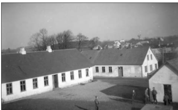
Skolen – med lokumsbygningen helt til højre