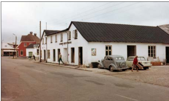
Den gamle brugs rives ned 1964