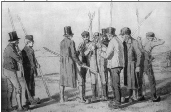
Borgervæbning med spyd

Hvorledes frie offentlige forsamlinger skulle ledes, havde dengang næppe én af 1000 noget ret begreb om. Af Stænderforsamlingerne havde kun få lært lidt om, hvordan det skulle gå til, men Schurmann skilte sig dog ret godt ved sit hverv. Forsvaret herhjemme var genstand for forhandlingerne, og der blev snakket meget frem og tilbage. Stiftamtmanden var indbudt til mødet, han sad helt ubemærket og stilfærdig henne i en vindueskrog. Et par gange blev han kaldt frem for at give en eller anden lille oplysning; han gav den i korthed og trak sig straks tilbage med et buk. Endelig enedes man om, at alle