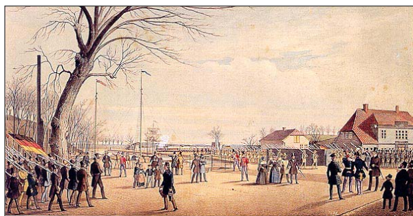
Oprøret er brudt ud i Rendsborg 24. marts 1848

Da nu tjenesten var endt, oplæste jeg skrivelsen i kirken og opfordrede menigheden til at gå med mig hen i skolen, hvor vi da kunne forhandle nærmere om sagen og begynde indtegningen af bidrag. Alle var vel forberedte, især kvinderne var rørte, og deres fantasi førte dem ofte langt ud over den bedrøvelige tilstand, i hvilken krigsfolket befandt sig ifølge øvrighedens skrivelse. Mangelen på varme klæder, vanskeligheden ved at få kornet malet derovre osv., blev udmalet i stærke udtryk, som fx "at de stakels karle derovre måtte gå - det var i fastetiden - med de bare ben i træskoene" og "æde den fenne bare rov". En mængde uldstrømper og trøjer blev straks indleverede, en del rug og andre viktualier blev indtegnede, også noget i penge, og få dage derefter kunne vi sende masser af genstande til Nibe til videre forsendelse.