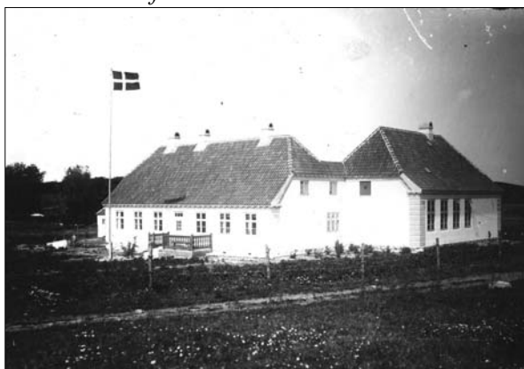
Guldbæk skole fra 1917