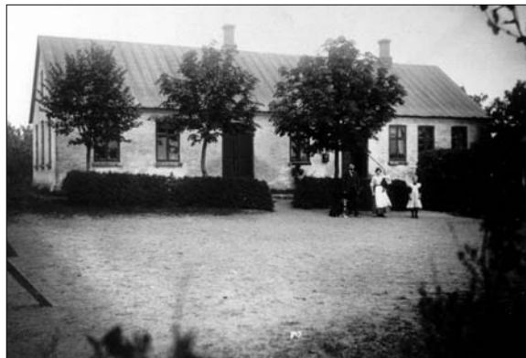
Hæsum skole fra 1890