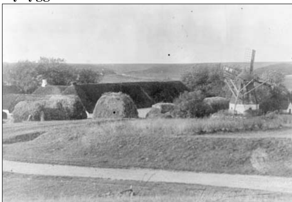
Hvor møllen ses på dette billede lå førhen Hæsums første faste skole

I 1878 var den gamle skole i Hornum blevet for ringe, så byen fik en ny skole i og i 1883 blev Hæsum skole gjort til fast skole. Sognerådet havde længe strittet imod, med henvisning til at det var et fattigt sogn, men til sidst måtte man bøje sig. Den gamle skole skrev sig helt tilbage til 1819. Den lå lige nord for Foghs gård. Den nye kom op at stå i 1890, og mens byggeriet stod på lånte man en stue ovre hos Kr. Rye. Den gamle skolebygning er for længst raget ned, men den ny eksisterer, trods flere moderniseringer i så nogenlunde genkendelig skikkelse.