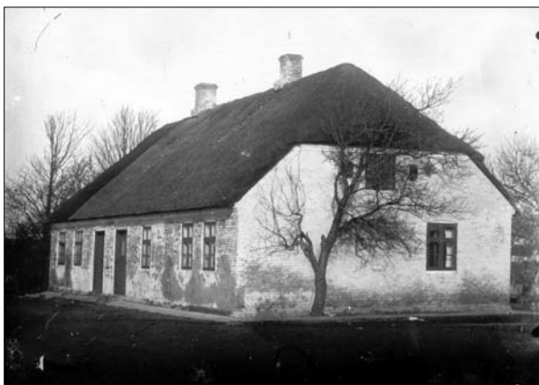
Skolen mellem Guldbæk og Volstrup efter en del udvidelser og forbedringer – foto fra ca. 1910