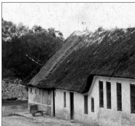
Til venstre ses den helt gamle skole efter ombygning 1878 til lærerens stald