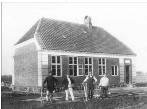
Volstrup skole fra 1917