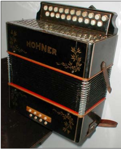
Torækket harmonika med otte basser

fædrene side var da også spillemand, samtidig med, at han også var jordemodermand i Ellidshøj. Han spillede til fest og han spillede til sorg, men hans kone havde nok de bedste indtægter. Da jeg var syv år, gav min far mig min første enrækkede harmonika med to basser og forskellige toner ud og ind. Den første melodi jeg lærte at spille var: Dejlig er den himmelblå ... Senere fulgte andre julesalmer og efterhånden alle de melodier, jeg kendte. Denne første lille harmonika blev hurtigt trukket itu. Så fik jeg fat i en noget større harmonika, torækket med otte basser. På den spillede jeg til en hel del juletræsfester. Efter de egentlige sanglege, når de mindste blev bragt til ro, gav jeg den med den toppede høne, skottish, hopsa, vals, tango og foxtrot. Hertil dansede de danselystne yngre voksne også med. Da jeg var tretten år udskiftede jeg min torækkede harmonika med en to og en halv række Hohner klubharmonika, en sådan har jeg stadig og jeg fortsætter spilleriet. Jeg blev inspireret af vores ko-kontrolassistent, som havde en sådan Hohner klubharmonika. Han havde købt den på postordre hos Hohner i København.