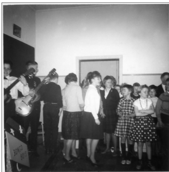
Der blev lyttet andægtigt til musikken.