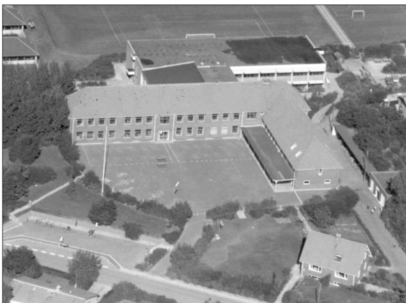
Øster Hornum Skole set fra luften 1980

På dagen startede jeg igen min trofaste gamle Morris 1000 og kørte mod Øster Hornum. Jeg kom i god tid og benyttede lejligheden til at kigge mig om i byen og i omegnen, som på den dejlige forårsdag tog sig ud fra sin allerbedste side. Kort inden det fastsatte tidspunkt satte jeg mig i græsset på en gravhøj ved Hæsum, røg en King's og tænkte igennem, hvad der skulle siges, da jeg var klar over, jeg gerne ville have arbejdet på skolen. Derfor gjaldt det om at være så velforberedt og afklaret som muligt.