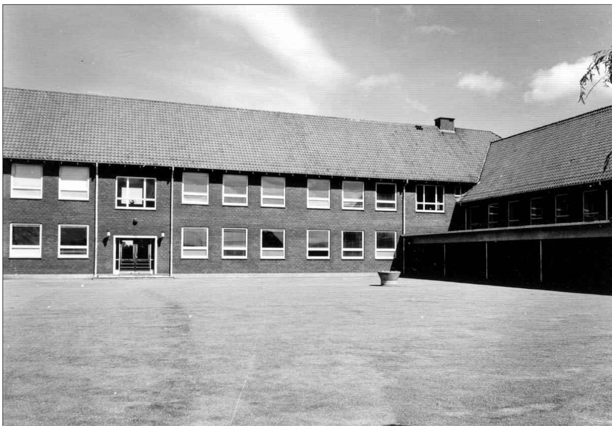
Øster Hornum Skole i 1960'erne

Dette er noget af det, jeg har oplevet i mit liv ved Øster Hornum skole i tiden 1955 - 1991. Det er muligt, det ikke er den hele sandhed, og det er muligt, at hvis mine gamle elever skulle berette det samme, så ville det lyde helt anderledes, men bemærk så, at jeg ikke skriver, det er virkeligheden, men at det er, som jeg husker det. Et godt og virksomt liv.