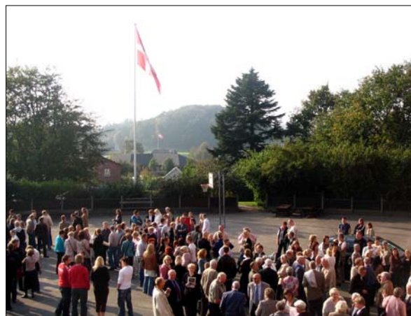
Om lørdagen for tidligere elever og lærere