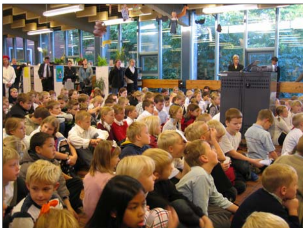
Om fredagen for skolens nuværende elever