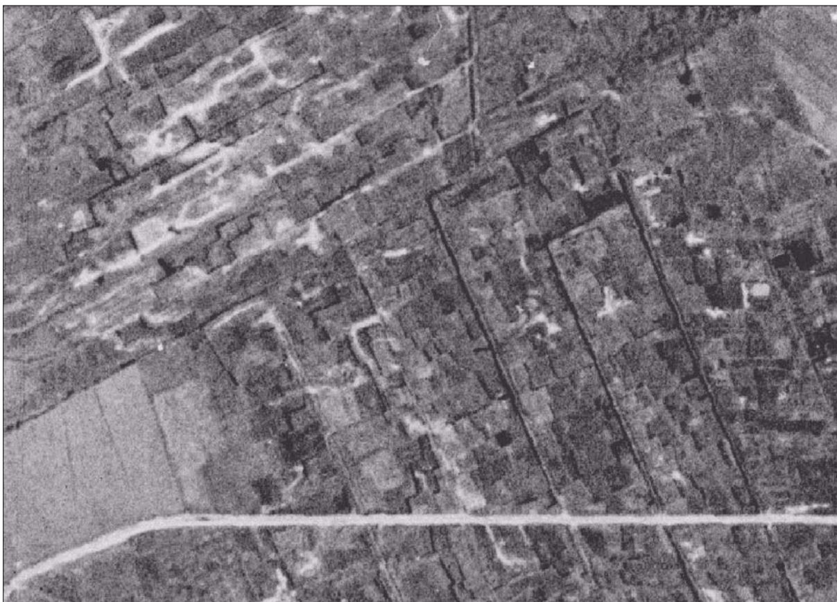
Luftfoto af Hæsum Mose 1945 – man ser tydeligt de mange steder, hvor der har været gang i tørvegravningen

Alt i alt et hårdt liv, så jeg tror ikke mange af os taler henført om ”de gode gamle dage”.