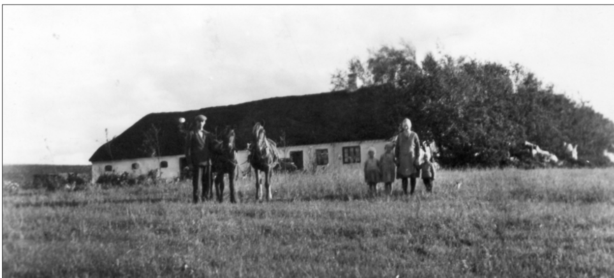
Hjemmet i Mastrup, nu Nibevej 15