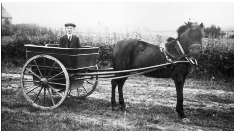
Dreng i jumpe