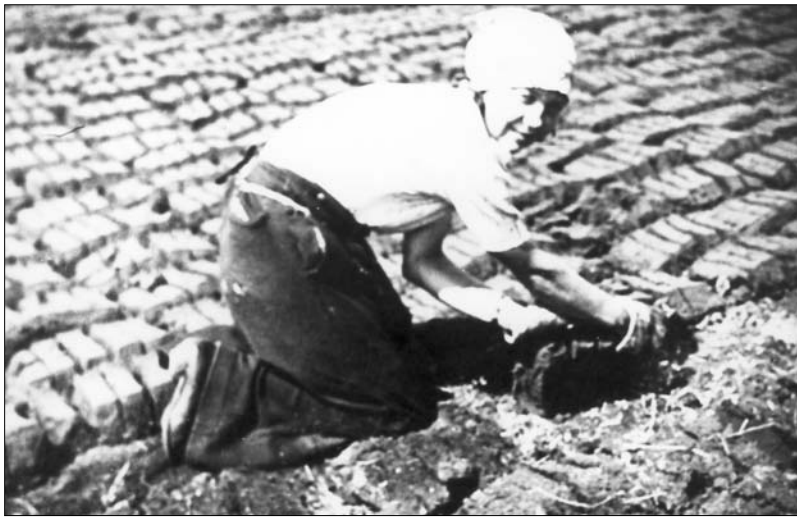
Tørvene vendes, her i Hyllested

Når tørvene senere skulle vendes og stakkes, gik de ældste børn fra skolen til mosen, og senere på dagen, når arbejdet var ovre, igen på gåben til hjemmet i Mastrup. Vi yngre børn havde de senere år cykler. Vi døjede ikke med overvægt!!