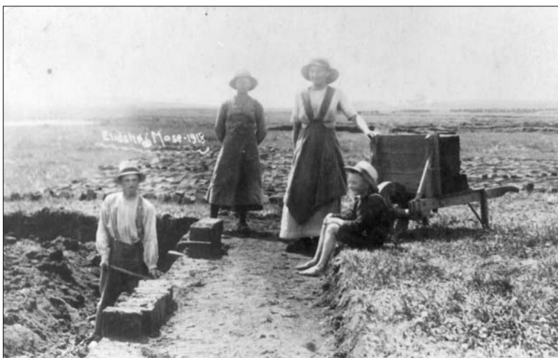
Nyopgravede tørv, her fra Ellidshøj 1918

Tørvene, der hvert år gravedes, blev leveret til mejeri, bager, skomager og skole i Støvring. Det drejede sig om første hold. Andet hold gik til familiens eget forbrug. Leverancen til Støvring ophørte kort efter krigen.