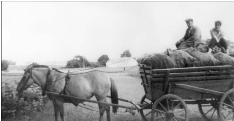
Tørvene køres hjem, her i Sørup

Vi børn husker tiden på forskellig måde. Det har jo nok været hårdt, det er dog ikke dette, vi husker så meget om, men mere oplevelsen. Vi kedede os ikke i vores barndom.