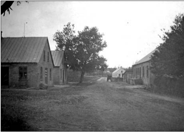
Nibevej mod nord med Brugsen, forsamlingshuset, fattighuset og mejeriet ca. 1905

På samme måde kunne det give kamp til strengen, når det skulle fastslås, hvilken kommune, der skulle lægge ud for alimentationsbidrag (børnepen­ge) indtil barnefaderen selv kunne betale – eller indsættes til afsoning af beløbet i fx Nibe arrest, hvilket skete i en del tilfælde, hvis man altså fandt frem til vedkommende. En del sager ses gennem årene afsluttet på den måde, at barnefaderen sandsynligvis var stukket af til Amerika og derfor hang kommunen på regningen.