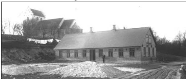
Den nybyggede skole i Øster Hornum. Det var her sognerådsmøderne blev holdt

Samfundet udviklede sig med stor hast i perioden fra 1883 til 1908. Perioden var først og fremmest præget af andelsbevægelsen, som med stor kraft slog igennem også i Øster Hornum, hvor der blev oprettet mejeri, brugs, sparekasse og forsamlingshus på andelsbasis. Samtidig blev der dannet ungdomsforening og afholdsforening. I Molbjerg havde Indre Mission et så stærkt tag i dele af befolkningen, at der kunne bygges et missionshus. En ny, moderne fire-klasset skole var blevet bygget og de første telefoner var kommet til byen.