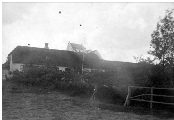
Ældst kendte billede fra Øster Hornum visende skolen og kirken – fra ca. 1890

Før i tiden var der også muligheder for at få hjælp, men mulighederne var af en væsentlig anden karakter. Systemet byggede først og fremmest på, at man klarede sig selv eller at ens nærmeste familie tog sig af én, specielt når man kom op i årene. Det var fx almindeligt, at man på landet ved generatonskifter på gårdene og på husmandstederne tegnede aftægtskontrakter, der gik ud på, at man som en del af overdragelsen af bedriften til den yngre generation betingede sig husly, mad og pleje livet ud.