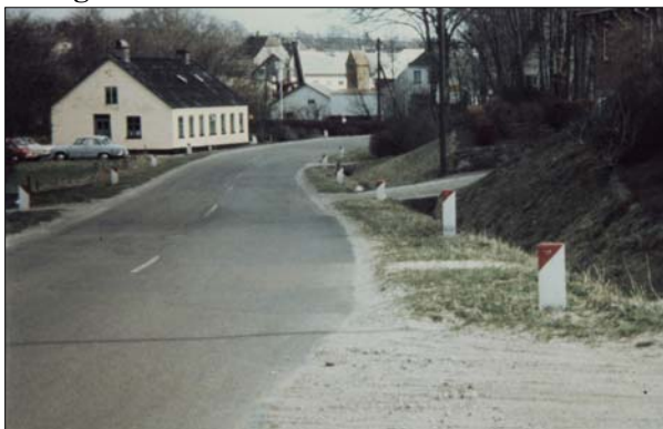
Fattighuset kort før det blev revet ned

Var problemerne vokset en person helt over hovedet var der snart kun fattighuset tilbage. Fattighuset var et ikke særligt stort hus, inddelt i små lejligheder. I perioder boede der temmelig mange mennesker i alle aldersklasser i huset. Husets oprindelse fortæller sig tilbage i de lokalhistoriske tåger, men det må formodes, at det første af slaget blev bygget midt i 1800-tallet. Det oprindelige hus brændte i efteråret 1899 og der blev opført et nyt i løbet af sommeren 1900, beliggende på samme adresse, nemlig lige syd for Bydammen. Huset blev bygget 21 alen langt og 12 alen bredt og stod frem til slutningen af 1960'erne, hvor det gik under navnet "Kommunehuset" og fungerede som udlejningsbolig.