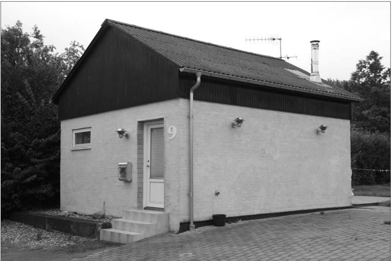
Frysehuset som det nu fremstår – som privatbolig

generalforsamling var som regel en hurtig affære, hvor formanden konstaterede at året var gået godt, frysehuset havde virket tilfredsstillende, og at man nu havde afdraget så og så meget på låne- ne, og at frysehuset ”bugnede af indleverede pakker”. Mange af formandens beretninger er bevaret i skitseform og fylder kun syv til ti linier. Flere år gik økonomisk så godt, at man kunne afdrage eks- traordinært på de optagne lån. Når man så var blevet enige om åbningstiderne og priserne for boks- leje for det næste år gik man i gang med kaffebordet og hørte evt. et foredrag. Fx holdt en konsulent Larsen foredrag og viste billeder fra sin Amerikatur på generalforsamlingen i 1952. Lidt nyt skete der dog. Således var der allerede i 1953 pladsmangel, så der opstilledes ekstra fire bokse.