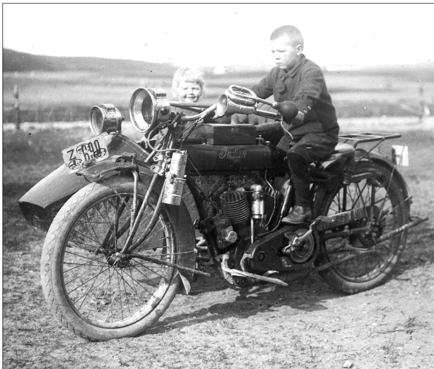
Billedet af den kraftige Indian motorcykel med sidevogn er taget af lærer Stig Nielsen i Guldbæk.

Hvem børnene er ved vi ikke, men det ser ud til at de har det sjovt – måske får de også lov at trutte i det kraftige horn, der er monteret på styret.