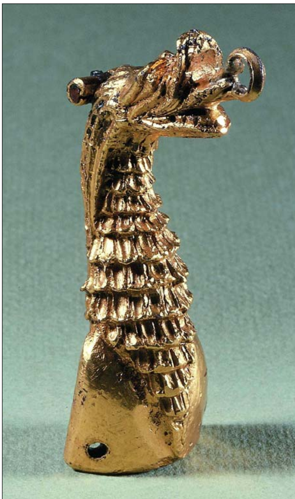
Kopi af den cirka 8 cm høje lueforyldte hank fra Sct. Kjelds Ark. Kopien findes på Viborg Stiftsmuseum, som har stillet billedet til rådighed

Dig, den høje i dyders kunst, har han forudbestemt til hersker – omsorg med ris, brød, stav og derhos den årvågne vogtende hund.