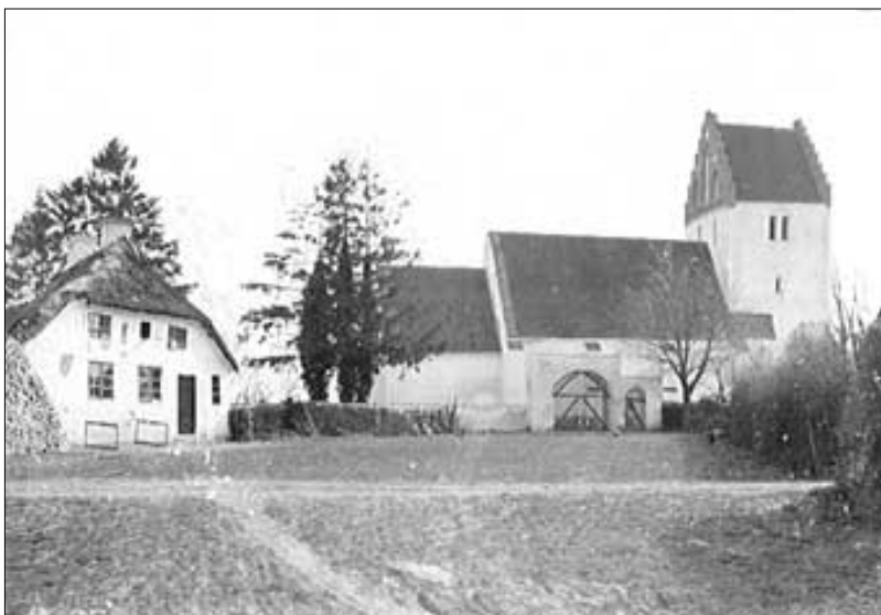
Døllefjelde Kirke og præstegård cirka år 1900.

Det skal bemærkes, at for mange af de omtalte afbildninger af Sct. Kjeld er der for en stor dels vedkommende en del usikkerhed om, hvorvidt det er Sct. Kjeld eller en anden, der oprindeligt er tænkt på. En senere tolkning, der er indgået i den kirkelige forståelse af figuren, må her tages til efterretning.