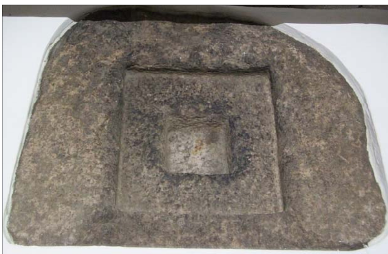
Altersten i granit med hul til en helgengrav. Fundet i Viborg, nu på Viborg Stiftsmuseum

Der findes som oftest beretninger om helbredelser og andre mirakler ved helgenernes grave, hvorfor sådanne ofte blev valfartssteder, hvor man søgte trøst og lindring for diverse sygdomme. Der kunne jo i sagens natur ikke være helgengrave alle steder, så man kunne også nøjes med mindre, fx små rester af helgener eller deres efterladenskaber; en smule hår, en bloddråbe, en tand, et stykke stof fra en helgens kappe, ja mulighederne var udtømmelige.