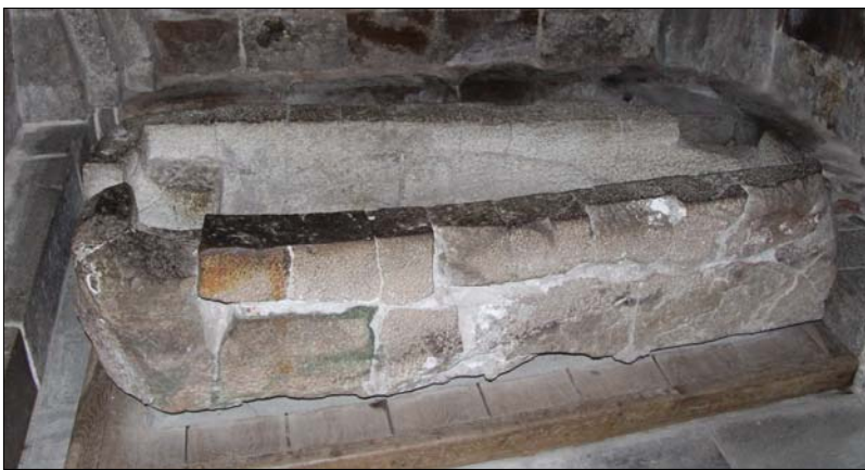
Stenkisten i kryptens nordre kapel

Et lueforyldt cirka 7 cm langt dragehoved, fundet 1864 ved domkirkens nedbrydning, stammer sandsynligvis fra dette helgenskrin. I Viborg Domkirke findes dog endnu Sct. Kjelds brønd i kryptens søndre kapel. Der er ikke vand i den, men der er kantsten omkring den.