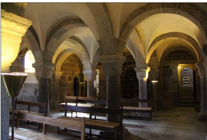
Krypten under Viborg Domkirke

På en vandring, arrangeret af Viborg Pilgrimscenter, gik man for nogle år siden fra Viborg til Venning og Ålum for at finde Kjelds barndomsegne, og på ruten fik man set den stadig benævnte ”Sct. Kjeldsgård”, som er udflyttet efter hans tid til en højere placering nordvest for Venning, og desuden fandt man kort herfra Sct. Kjelds kilde, som nu har sit udspring i en dyb brønd ført under landevejen mellem Viborg og Randers. Det er en meget vandrig kilde med rent og klart vand. Man fik den anvist af en ældre mand fra Venning. På ældre kort ses kilden tydeligt aftegnet.