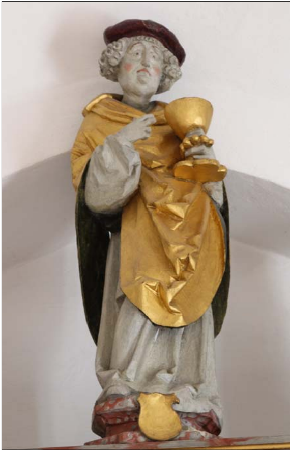
Sct. Kjeld på toppen af alteret i Åby Kirke

I Åby Kirke, Åbybro, har Sct. Kjeld fået en fornem placering, nemlig som en 75 cm høj bemalt træfigur øverst på altertavlen.