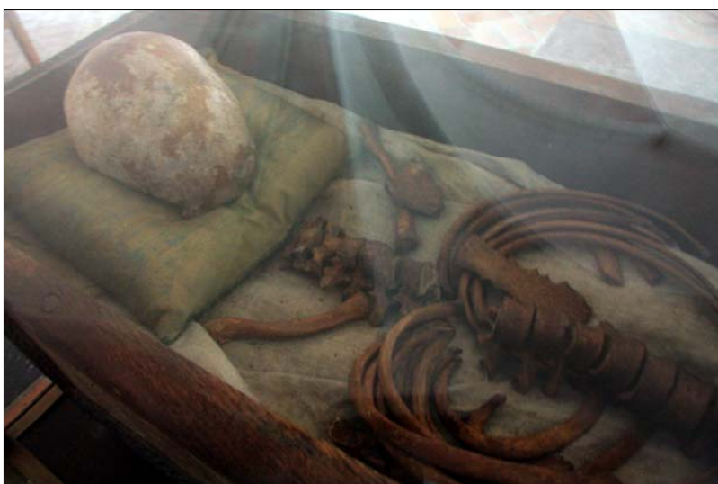
Knud den Hellige i krypten under Sct. Knuds Kirke i Odense

Det var som nævnt ikke mange danskere, der i den katolske tid blev kåret til helgener, men nogle få fandtes dog. Den mest kendte er nok Knud den Hellige, der blev helgenkåret i 1101. Ifølge den nedskrevne helgenlegende levede han så fromt, at Djævelen i misundelse fik Knuds brødre til at vende sig imod ham og ophidsede hans mordere til at slå ham ihjel. Da Knud blev myrdet, strakte han sine arme ud som et kors og blev stukket i siden med en lans; ligesom Jesus på korset. Mere historisk korrekt vil det nok være at sige han som konge var noget af en tyrann, og at hans fjender fik ham myrdet i Albani Kirke i Odense.