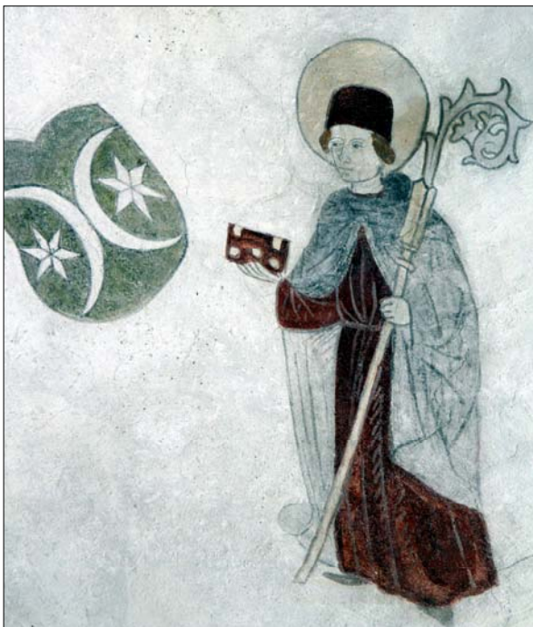
Sct. Kjeld i Vejlbj Kirke