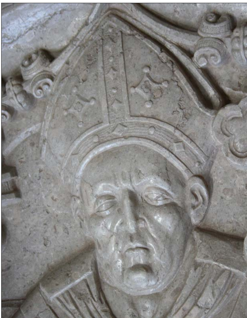
Absalons gravsten i Sorø Klosterkirke

Efter Kjelds død bredte fortællinger sig om, at der skete mirakler ved hans grav. Mange blev helbredt og befriet for onde ånder. Hele tolv blinde skal have fået synet igen efter at have besøgt graven, spedalske blev helbredt, stumme fik talens brug og endelig blev en mand, der havde brud på mavesækken, så hans indvolde hang næsten lige til knæene, helbredt. Derfor skrev kongen og landets biskopper til paven for at få Kjeld anerkendt som helgen. Den 9. juni 1188 befalede pave Clemens den 3. biskop Absalon at undersøge provst Kjelds levned og beretningerne om underne ved hans grav, og hvis Absalon fandt beretningerne troværdige, skulle han helgenkåre Kjeld og bestemme, hvordan han skulle fejres.