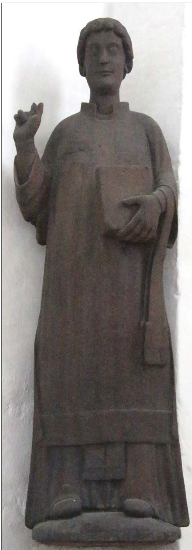
Sct. Kjeld i Øster Hornum Kirke