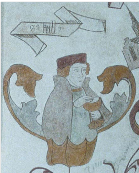
Sct. Kjeld i Vor Frue Kirke i Skive.

I venstre hånd bærer han en kalk, som han velsigner med højre hånd. Kalken og kappen er forgyldte.