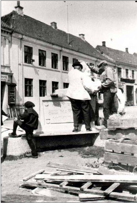
Sct. Kjeld Brønd opstilles på Nytorv 1914.

I dag holder man i Viborg med navnene Sct. Kjelds Gade og Sct. Kjelds Brønd på Nytorv opsat i 1914 mindet om byens helgen levende.