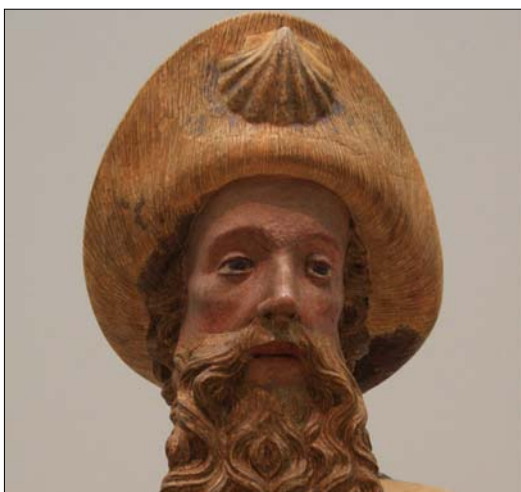
Sct. Jacob med muslingeskal

blev samtidig understreget, at hvis helgengraven blev skilt fra alteret eller beskadiget, var relikviernes magt brudt. Kirken måtte da indvies på ny. Efter reformationen i 1530'erne blev mange af disse relikvier fjernet fra kirkerne.