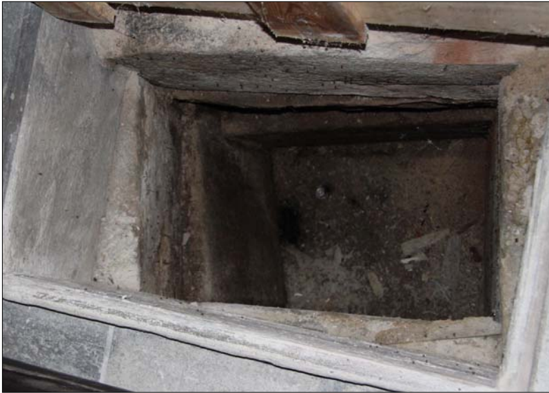
Sct. Kjeld Brønd i kryptens søndre kapel

”Sct. Kjelds Ark” gik til grunde i 1726, da det meste af Viborg by inklusiv domkirken blev lagt øde af en stor brand.