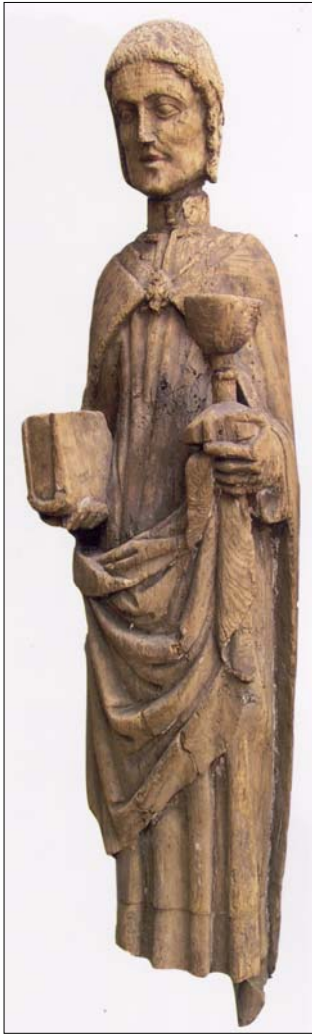
Sct. Kjeld fra Lundø Kirke.

Før i tiden stod i Lundø Kirke nær Skive en træfigur forestillende Sct. Kjeld. Denne figur har stor lighed med den i Øster Hornum. Den er næsten lige så høj, nemlig 138 cm og ligeledes udskåret i egetræ. Kjeld bærer i sin højre hånd en lukket bog og i venstre hånd en kalk. Klædedragten er den samme højhalsede kjortel og en løs kjortel uden over. Som på de øvrige figurer og afbildninger er Kjeld skægløs. Denne figur befinder sig nu i Nationalmuseets magasin.