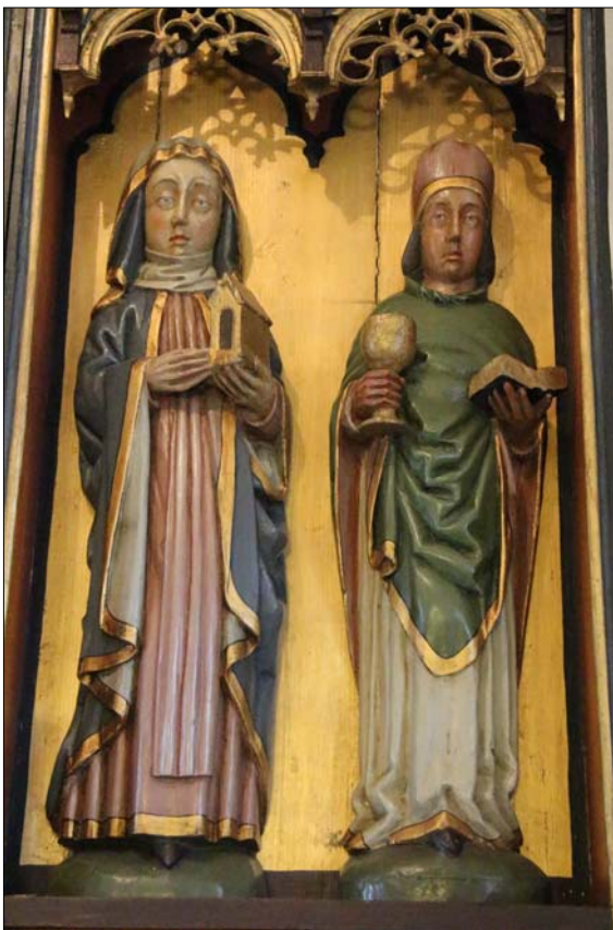
Sct. Gertrud og Sct. Kjeld i Sejlflod Kirke

På Sct. Kjelds helgendag den 11. juli blev der holdt et stort marked i Viborg, og et gilde i byen bar Sct. Kjelds navn, så Viborgs borgere har opfattet Sct. Kjeld som deres særlige helgen.