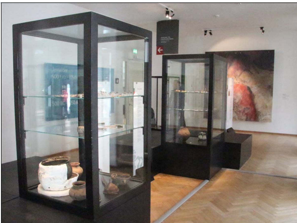
Udstillingen med "udvalgte danefæ" på Nationalmuseet