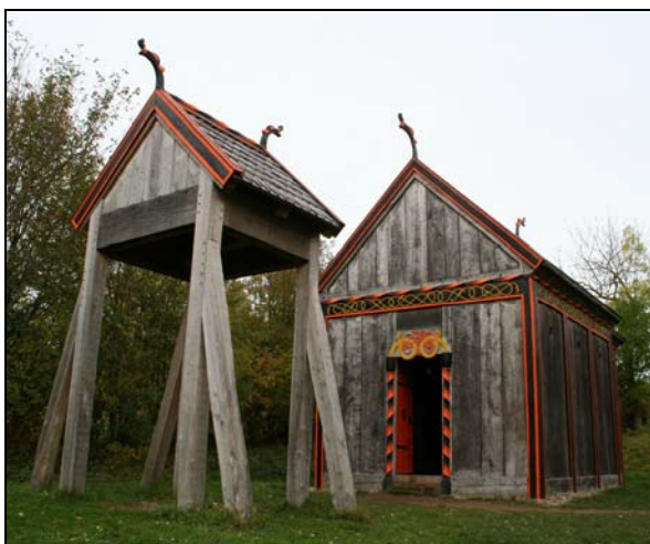
Rekonstruktion af stavkirke ved Moesgaard Museum. Kirkens dekorationer er inspireret af træplanke, dekoreret i Urnesstilen, fundet i Hørning Kirke