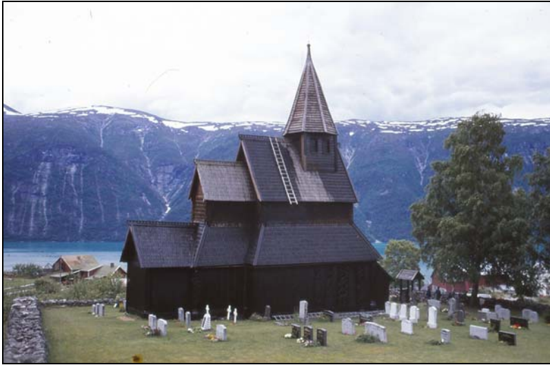
Urnes Stavkirke højt over Lustrafjorden i Vest-Norge

Urnesstilen er let at kende på sit slanke, elegante dyre- og planteslyng. Hovedparten af Urneskunsten består af kraftigt stiliserede dyr, der snor sig om hinanden. Tomrum fyldes med bølgende slyng i dynamiske ottetalskompositioner, der næsten aldrig er symmetriske. Alle dyrenes lemmer er blevet trukket ud, så de ikke står til at artsbestemme.