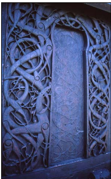
Udsmykning på stavkirken i Urnes, Norge

Netop kirkeudsmykning er et vigtigt sammenligningsgrundlag. Eftersom Urnesstilen udelukkende findes i den kristne del af vikingetiden, er det sandsynligt, at mange kirker har været udsmykket i denne stil. To kendte eksempler er Urnes stavkirke i Norge og rekonstruktionen af en stavkirke på Moesgård museum. Denne rekonstruktion er baseret på en træplanke, dekoreret i Urnes-stil, der blev fundet i Hørning kirkes murværk.