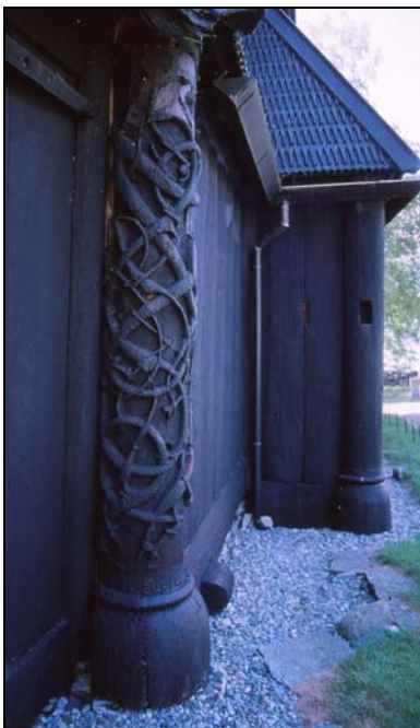
Hjørnestolpe med udskæring på Urnes Stavkirke

Urnesstilen er let at kende på sit slanke, elegante dyre- og planteslyng. Hovedparten af Urneskunsten består af kraftigt stiliserede dyr, der snor sig om hinanden. Tomrum fyldes med bølgende slyng i dynamiske ottetalskompositioner, der næsten aldrig er symmetriske. Alle dyrenes lemmer er blevet trukket ud, så de ikke står til at artsbestemme.