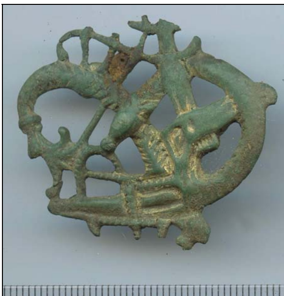
Urnesspændet, fundet ved Øster Hornum

Siden metaldetektoren kom til Danmark i midten af 1980'erne, er antallet vokset dramatisk. I 1983 kendte man til omkring 25 i Danmark og Slesvig, og allerede 11 år senere i 1994 var tallet over 100. Mange af disse er løsfund, der ikke fører til nogen udgravning. Dette faktum gør, at de fleste detektorfund ikke kan placeres i en kontekst, hvilket mindsker deres udsagn væsentligt. Dog har det betydet ganske meget for vores forståelse af distributionen af visse genstandsgrupper. Et sådant detektorfund blev som sagt gjort på en mark i Øster Hornum.