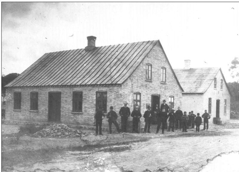
Øster Hornum brugsforening og forsamlingshus kort efter opførelsen 1889