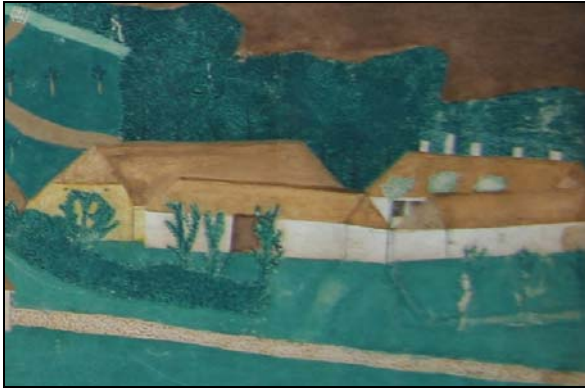
Den gamle præstegård