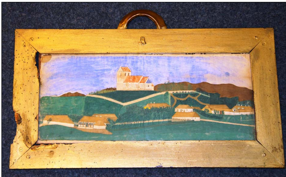
Billedet i sin ramme som det så ud ved indleveringen

For et par år siden blev der på Lokalhistorisk Arkiv ganske uventet indleveret, hvad der nok er det ældst eksisterende billede af Øster Hornum. Arkivet havde i forvejen en meget dårlig affotografering af billedet, og i skolens aula findes en kopi udført i oliemaling, så Arkivet vidste, at billedet fandtes et eller andet sted, men vidste ikke hvor, så det var med stor overraskelse og glæde Arkivet modtog billedet.