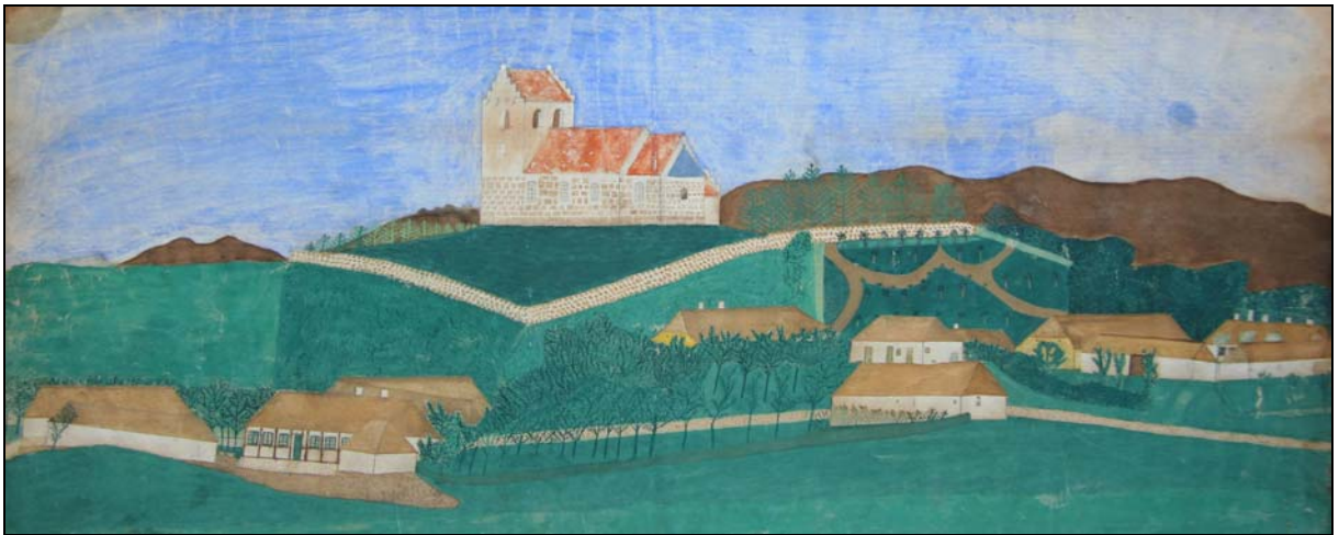
Øster Hornum 1866

Billedet er først tegnet på et stykke kraftigt papir med en tynd blyantstreg og efterfølgende malet med en slags vandfarve.