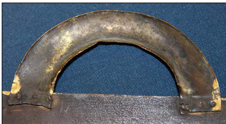
Ophænget set fra bagsiden

Billedet, der måler 40 cm gange 17 cm, var i sin tid omhyggeligt sat i glas og ramme. Glasset var intakt, men rammen noget medtaget af tidens tand, og navnlig havde en flok ihærdige borebilleder gjort træet temmelig skrøbeligt.