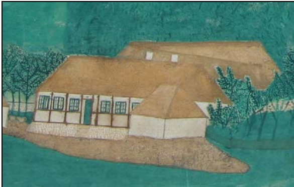
Gård midt i byen

Billedet er så vidt vides det eneste, der findes af disse bygninger.