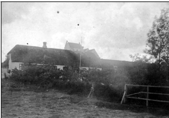
Skolen fra 1879 med kirken i baggrunden

Huset, som på det gamle billede er tegnet med to skorstene nedenfor kirken, var fra gammel tid byens skole. Vi ved, at den blev erstattet af en nybygning i 1879. Denne ses her på billedet fra omkring 1905 helt til højre, sammenbygget med den helt gamle noget lavere skolebygning. Denne fungerede nu som udhus for læreren til opbevaring af hans kreaturer, avl, brændsel, vogn og andet. Til venstre ses den fire-klassede skole fra 1901.