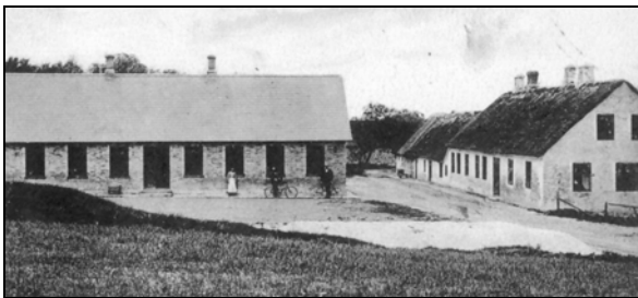
Fra venstre ses skolen fra 1901, den helt gamle skole og længst til højre skolen fra 1879

På billedet her til venstre, der er taget omkring 1905, ses de samme tuer, hvor der er foretaget begravelser. Kun enkelte gravsteder er markerede og indhegnede, som det blev skik i de første årtier efter år 1900.