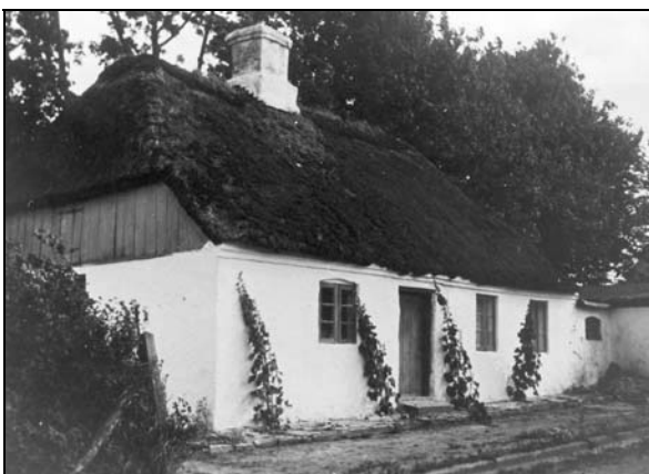
Det stråtækte hus på Gl. Skolevej

Lærerparret boede i den nordlige ende af bygningen, mens skolestuen var i den sydlige. Efter 1901 blev den tidligere skolestue omdannet til bolig for andenlæreren.