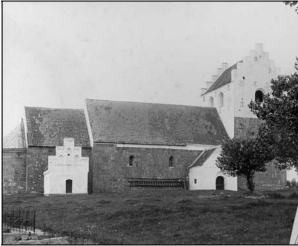
Kirkegården omkring 1905

Nu er det vist på tide at vende tilbage til billedet af Øster Hornum i midten af 1860'erne, hvor kirkegården ses uden synlige gravsten, kun tuer i græsset, der viser hvor begravelserne har været foretaget.