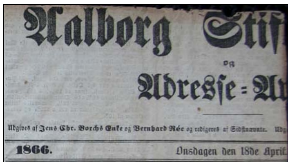
Avis siden fra "1866, Onsdagen den 18de April"

På billedet ses yderst til højre den gamle præstegård, der brændte 13. juni 1889, og huset med den gule gavl og de to skorstene er byens ældste to-klassesde skolebygning, der i 1879 blev erstattet af en nybygning, stadig en to-klasset skole, lige syd for den gamle. Denne blev allerede i 1901 erstattet af en ny og langt mere rummelig fire-klasset skole, hvor nu hele to lærere stod for undervisningen. Det er bygningen fra 1901, der nu huser Rebild Husflidsskole. Bygningen, der ses her på billedet fungerede efterfølgende som stald for skolelærerens dyr og oplagring af afgrøder, brændsel og andet. Alt dette betyder, at billedet må være fra før 1879.