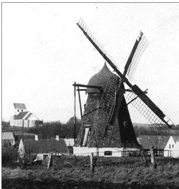
Møllen i Øster Hornum