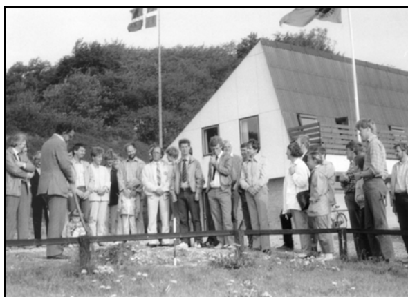
De første spadestik tages til Hallen 1984

Skrevet 2006 af Per Tolstrup til ØHI's jubilæumsskrift