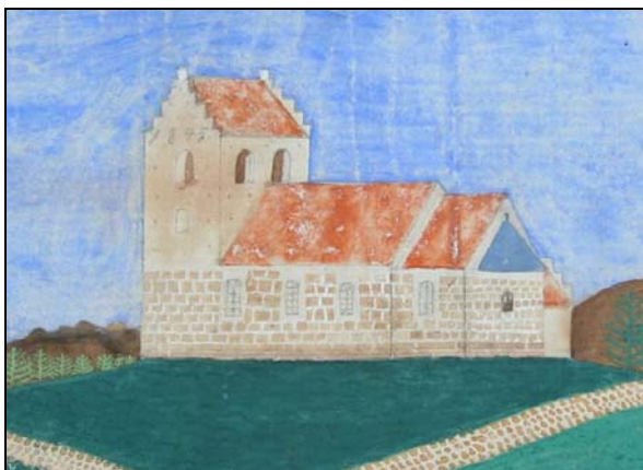
Øster Hornum Kirke 1866, ældst kendte bilde

Ifølge overleveringen er Øster Hornum Kirke i sin oprindelige skikkelse bygget i 1172. Det er den tid, man bygningshistorisk kalder romansk tid. Om årstallet er det helt præcise er det ikke muligt at bevise, men på den anden side er der intet i bygningens konstruktion, der modbeviser det. Kirken blev opført i tilhuggede granitkvadre efter samme koncept som alle øvrige landsbykirker blev på den tid med et kor i øst og et skib i vest. Som noget specielt skal bemærkes, at kirken blev opført med en apsis, en bygningsdel, der ellers normalt var forbeholdt større kirker. Loftet var et fladt bjælkeloft noget lavere end de nuværende gotiske spidsbuer. Apsis have dog