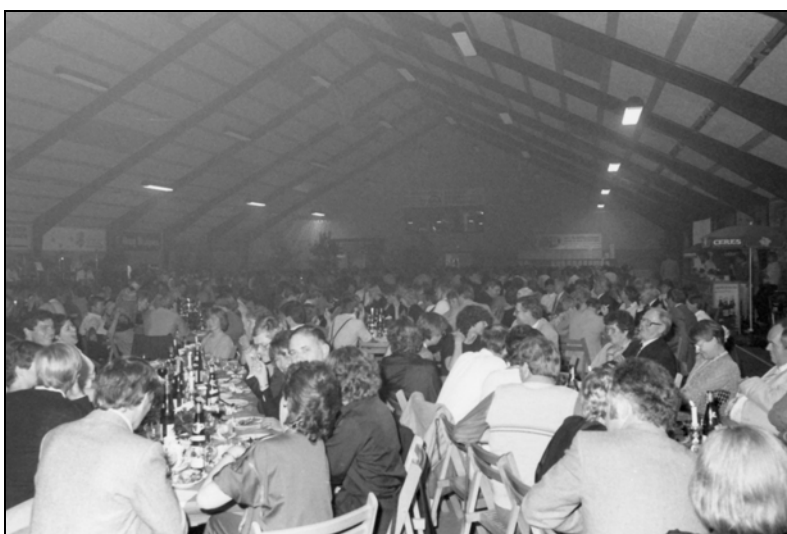
Hallens færdiggørelse blev fejret med en stor indvielsesfest