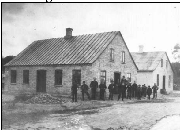
Samlingshuset i forgrunden og brugsen bagved cirka 1900

I vinteren 1888-89 blev der afholdt en del møder for at få bygget et samlingshus i Øster Hornum. Samtidig var der stærke kræfter i gang med at oprette en brugsforening. Der var tanker om at bygge en bygning, der kunne rumme begge foretagender, men det kunne man ikke blive enige om. Resultatet blev, at der blev bygget to næsten ens huse med få meter imellem på stedet, hvor Dagli'Brugsen ligger den dag i dag. Brugsen havde sin egen forening med bestyrelse og samlingshuset blev dannet som en særlig forening med navnet "Øster Hornum Samlingshus".