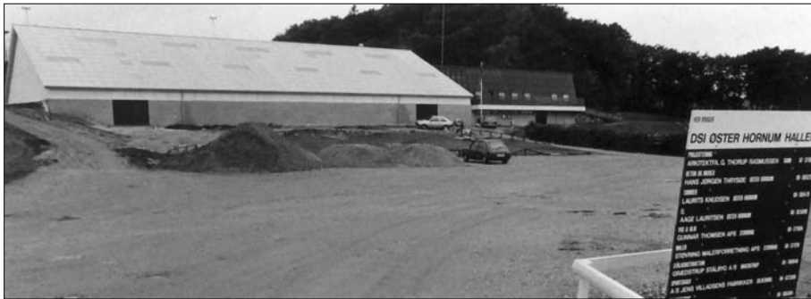
Hallen er ved at være klar til indvielse

jeg dog aldrig været vidne til, hverken før eller siden.