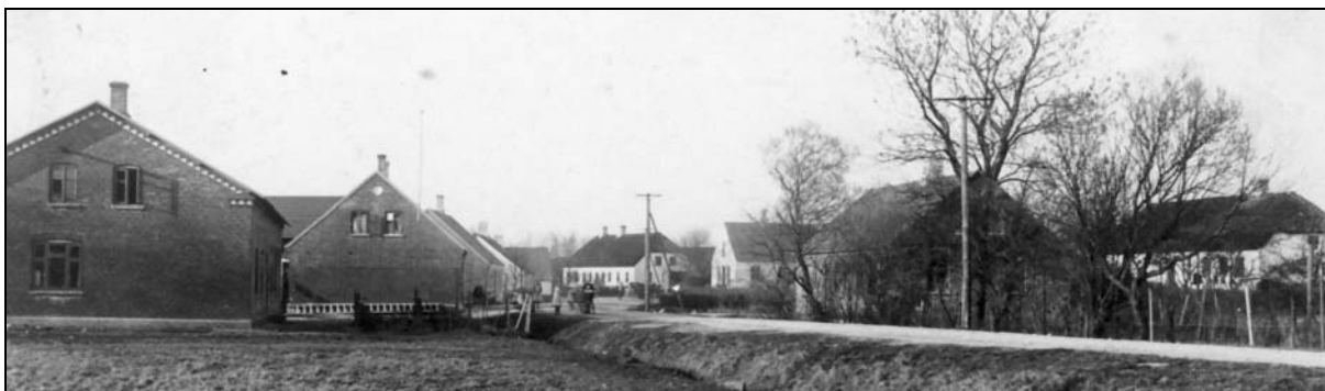
Til venstre ses det nybyggede forsamlingshus cirka år 1915

Der blev straks taget fat på at danne et nyt selskab, som skulle lade et nyt Samlingshus bygge. Betegnelsen ”forsamlingshus” overtog med tiden den ældre betegnelse ”samlingshus”. Det tog en del tid at få rejst den nødvendige kapital, men det lykkedes. Byggegrund til det nye forsamlingshus blev købt længere sydpå i byen mellem landevejen og skolens have. Forsamlingshuset blev så bygget i sommeren 1907, og det blev indviet om efteråret. I dette forsamlingshus blev der indrettet lejlighed for en familie, som boede der for at holde huset rent. Det ny forsamlingshus var meget større og flottere end det gamle.