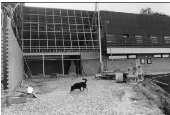
Indgang til Hallen 1984

Venstrefolkene der i de år kørte med et slogan der hed: ”Hjælp til selvhjælp”, sagde nej. Her kom Øster Hornums borgere og tilbød Støvring Kommune at bygge en fuld færdig, funktionel, driftsmoden hal, uden at det skulle koste kommunen 1 krone og så sagde de ”Nej tak”!