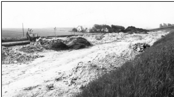
Der graves ud til Hallen

Vi fik kontakt til en arkitekt fra Tarm, der havde tegnet flere sportshaller. Vi tog en lørdag eftermiddag til Tarm for at møde arkitekten på hans kontor, hvor han tegnede og fortalte om, hvordan en sådan sportshal kunne se ud. Han viste os en hal i en lille by Hoven ved Skjern, som han været arkitekt på. Da vi havde set hallen, kiggede vi på hinanden og nikkede samstemmende: Det er sådan en hal vi kunne ønske os. Hvad kan vi bygge den for? 1,2 million kr. sagde han. Det du'r, sagde vi, tegn sådan én til os, med de krav der nu måtte komme i forbindelse med sammenbygningen af det eksisterende klubhus.