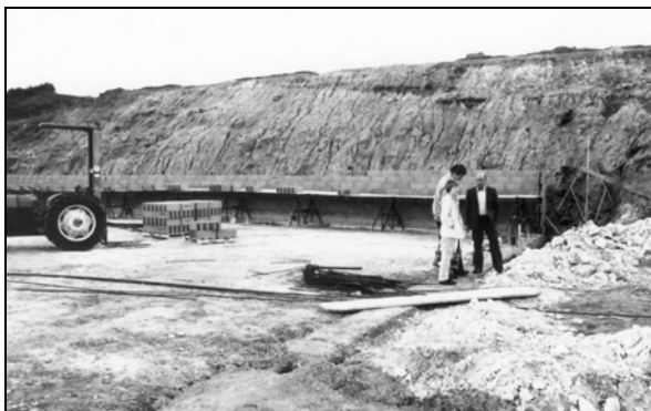
De første mure er nu blevet bygget

Øster Hornum Forsamlingshus. Og de kom. Salen var fyldt til sidste stol. Nu var folk jo tvangsindlagt til at høre på os. Om hvordan hallen skulle se ud. Hvad det ville koste. Hvordan den skulle finansieres. Hvordan den enkelte som ovenfor nævnt kunne hjælpe. Folk var særdeles positive.