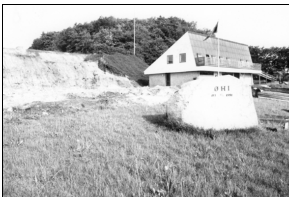
Den kommende hal blev bygget i forlængelse af det allerede eksisterende klubhus

Men vi havde jo ingen penge og vi kunne jo ikke vide om projektet nogen sinde ville blive en realitet. Vi fandt nogle sponsorer, der ville dække en del af arkitektudgifterne, jeg tror halvdelen, resten tog arkitekten på sin egen kappe, ifald projektet faldt til jorden. Han var utrolig nem og dejlig at arbejde sammen med. Vi satte ham i gang med at tegne, idet der foruden de faciliteter der var i det "gamle" klubhus, var nødvendigt med et par ekstra toiletter samt naturligvis et depotrum til hallen rekvisitter. Ellers kun den nøgne hal med plads til lidt tilskuere.