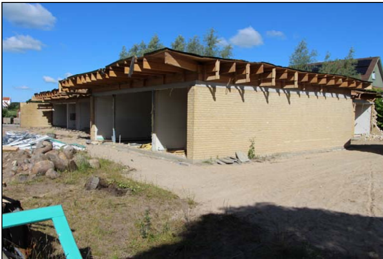
Børnehaven rages ned, juni 2014

Fra januar 2013 til august 2014 holdt børnehaven til på "Gården", Nibevej 164.