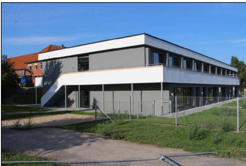
Børnehaven holder til i den udvidede underetage i "den ny fløj" på skolen

Et kapitel i byens historie var slut, og et nyt kan begynde!