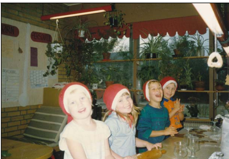
Nisser i køkkenet

Da alt var gjort op i efteråret 1975 læses dog i bestyrelsens protokol: "Byggeregnskabet for opførelse af børnehaven blev gennemgået. Byggeriudgifterne beløber sig til i alt kr. 709.343, kurstab samt indskud til byggeriets real-kreditfond beløber sig til i alt kr. 383.477, således at den samlede anskaffelsessum beløber sig til kr. 1.092.820. Underskuddet ved byggeriet beløber sig til ca. 130.000 kroner. Der foreligger tilbud fra Sparekassen Nordjylland om et lån på kr. 90.000 kroner til udligning af en del af underskuddet, resten tænkes dækket ind ved overførsel fra overskuddet fra børnehavens drift".