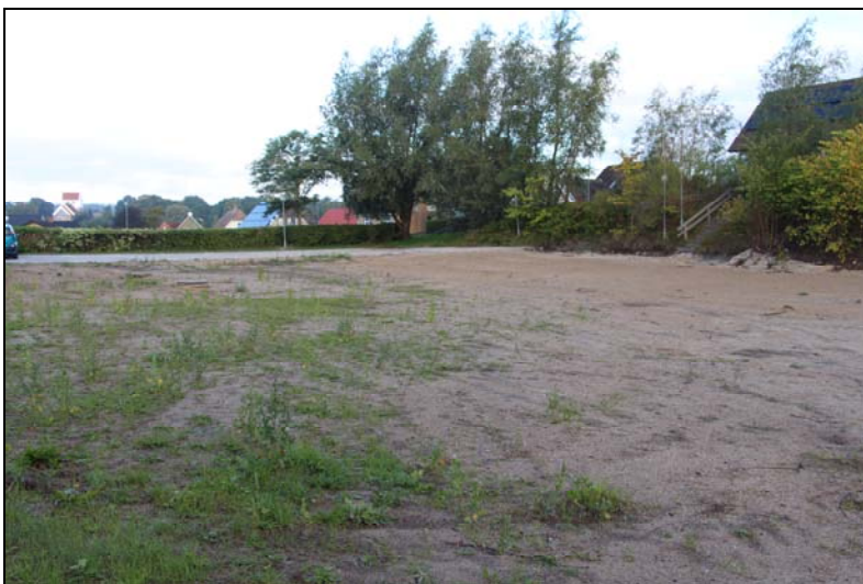
Der kan nu bygges beboelseshuse, hvor Børnehaven lå

I forsommeren 2014 blev den nu forhenværende børnehave revet ned.