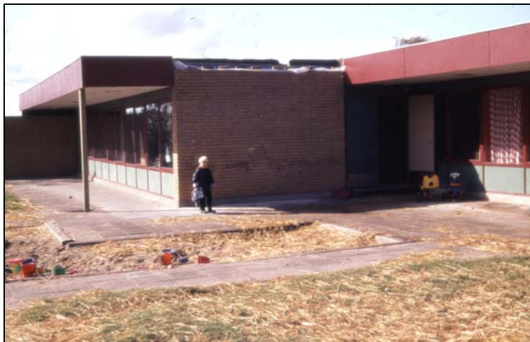
Børnehaven i begyndelsen af 1980'erne

Da Støvring Kommune blev dannet 1. april 1970, var der kun en børnehave i Støvring, nemlig ”Doktorvænget”, som lå tæt på stationen. I såvel Suldrup som Øster Hornum var der også ønsker om at få oprettet en børnehave for aldersgruppen tre til syv år, og man lod sig ikke nøje med ønsket; man gjorde selv noget ved sagen. I foråret 1972 blev der åbnet børnehaver i Suldrup, og Støvring fik samtidig sin anden børnehave.