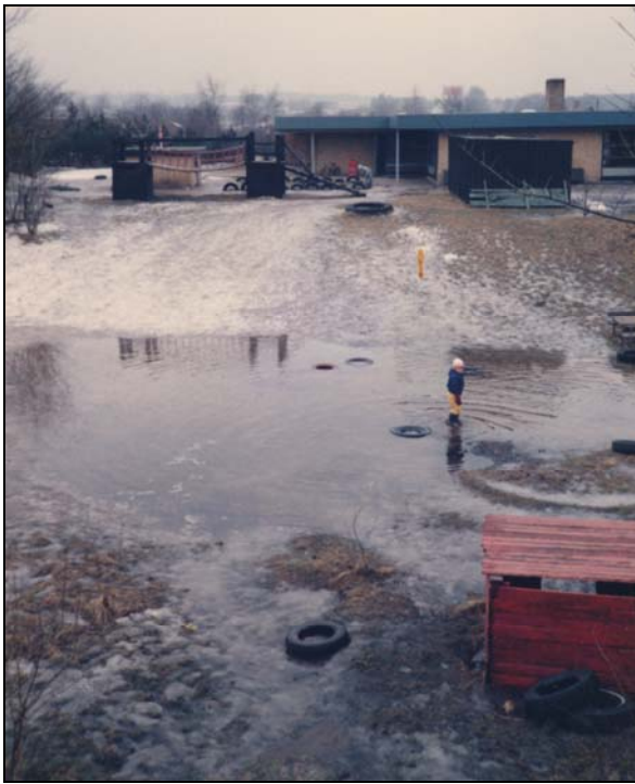
"Hullet" kunne sommetider blive fyldt med vand - og så var der en ny slags legeplads

beholdt stillingen i mange år, indtil hun i 1988 valgte at blive leder af skolefritidsordningen.