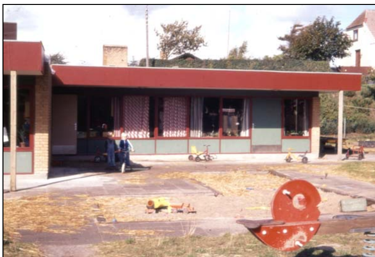
Børnehaven i begyndelsen af 1980'erne