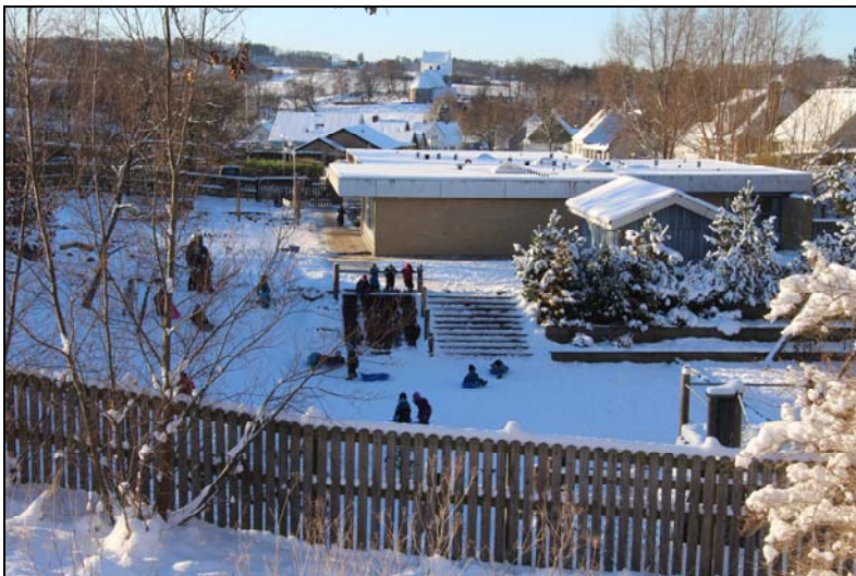
Børnehaven lige før lukning - december 2012

Et tilbagevendende problem for børnehaven var størrelsen af legepladsen. Man ønskede legepladsen udvidet med et areal op ad skrænten mod øst. En lille flytning blev der fra kommunens side indvilget i, men da arealet i følge kommuneplanen var område med offentlig adgang, kom der ikke mere ud af det trods bestyrelsens gentagne forsøg på overtagelse. Problemet ses fx i 1980: "På det stykke jord udenfor legepladsen har vi netop haft kommunens mand til at rydde op, men det har beboerne ødelagt igen. Vi prøver igen at få ryddet op, og får sat et skilt op med forbud mod aflæsning af affald".