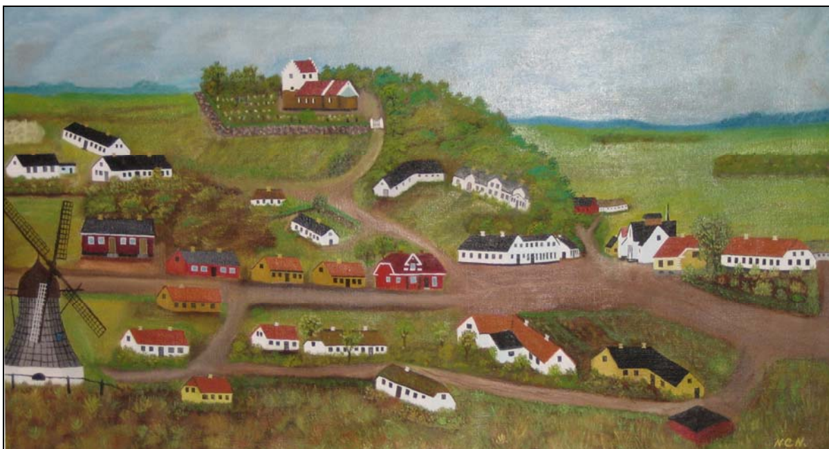
Niels Chr. Nielsen har på dette maleri efter hukommelsen givet sit bud på, hvordan Øster Hornum så ud i 1920'erne

Tiden den gang har vel også været medvirkende årsag til, at dette særdeles gode naboskab varede næsten livet ud. Her tænkes i særlig grad på tidernes ugunst og trange kår. For at forstå dette, kan det siges mere enkelt: Vi var alle i samme båd. Få havde for meget, og mange for lidt.