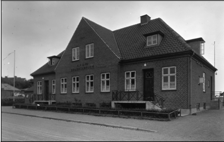
KFUM's soldaterhjem, hvor der var kaffe og hygge

berytget, frygtet og hadet for sin umenneskelige behandling af sit mandskab. I dag nærer jeg næppe tvivl om, at han for tyskerne har været den ideelle hipo-mand. Jeg mindes endnu, så mange år efter, det evindelige øvelsesgrundlag om fjendtlig landgang et eller andet sted i Syd-sjælland. De lange marchture på 30 - 40 kilometer ad islagte veje i den strenge vinterkulde med øvelserne under vejs kunne næsten regnes for en ugentlig foretelse.