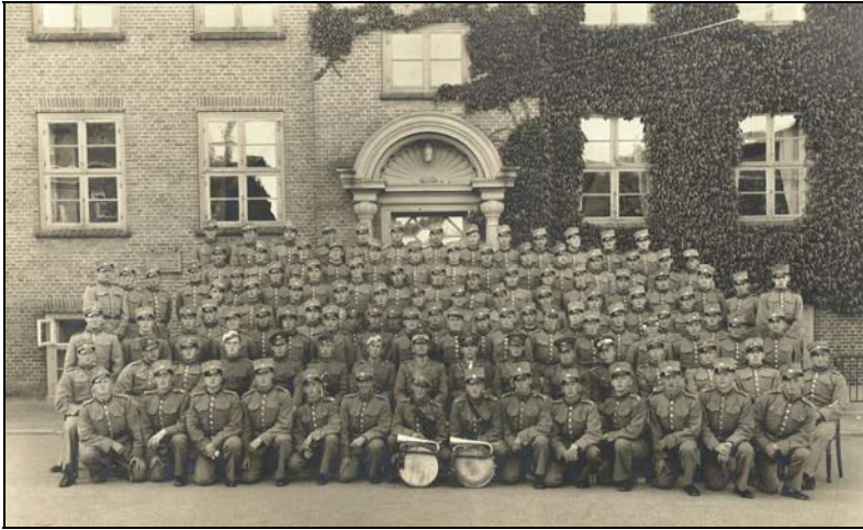
Et kompagni med officerer opstillet foran hovedbygningen "Dannevirke" på Vordingborg Kaserne

Da rekruttiden var overstået, steg vi en lille tand i graderne i den militære rangorden, idet vi nu var overgået fra rekrut til menige. Nu kunne vi betragte os selv som de såkaldte "gamle basser" og anlægge vores egen mentalitet og ikke længere behøvede at frygte en "elendig underkorporal" som noget overordrende. Vi mente endog at kunne tillade os en lidt frækkere adfærd over for vore mindre afholdte befalingsmænd.