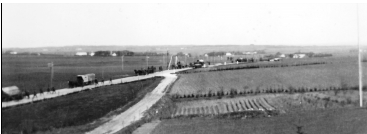
Vagn Lyngberg tog i maj 1945 dette billede set fra altanen på sin brors gård ”Uglehøj” lidt syd for Sørup, hvor man ser tyske soldater trække eller køre med hestevogn mod syd - knap så hurtige, kække og krigeriske som da de ankom 1940