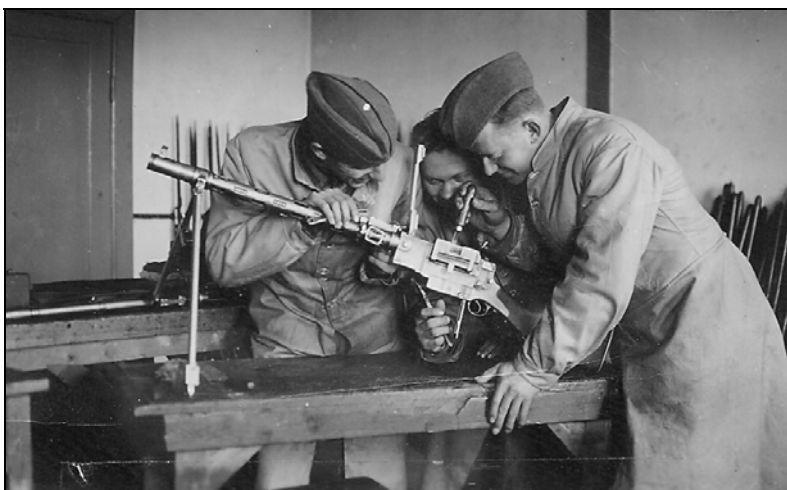
Soldater efterser et Madsen-maskingevær, formentlig i et pudserum på Vordingborg Kaserne

Ved firetiden vågnede jeg, som lå i nr. to seng fra vinduet og syntes at kunne høre motorstøj, hvilket forekom mig mærkeligt, eftersom der ikke fandtes motorkøretøjer på kaserne. Jeg stod op og kiggede ud ad vinduet mod øvelsespladsen, men bemærkede intet usædvanligt, og da ingen af stuekammeraterne vågnede, lagde jeg mig på sengen igen, men kunne naturligvis ikke sove mere. Der gik nogen tid, så var motorstøjen der igen og denne gang lød den nærmere. Det