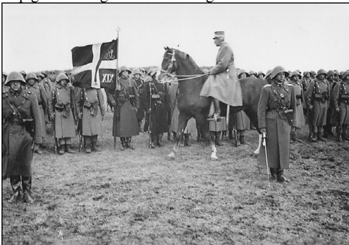
Christian d. 10. rider hen for at hilse på bataljonsfanen ved 19. bataljons 150 års jubilæum

Et opløftende moment i vinterens løb var dog, at jeg var hjemme i Øster Hornum på jule- og påskeorlov. Den sidstnævnte huskes især for de store besværligheder, der var forbundet med denne orlov. Rejsen frem og tilbage i påsken 1940, det var i marts, foregik med største besvær på grund af isen i Storebælt. Tilbagereisen var den mest dramatiske, idet at færgen sad fast i isen en 3 - 4 timer. Vi var nogle stykker fra det nordjyske, som ikke nåede tilbage til garnisonen i Vordingborg til den fastsatte tid for orlovens ophør. Det var vist klokken 24. Først om morgenen nåede vi tilbage og meldte, som reglerne påbød, os tilbage fra orlov hos vagtkommanderende og oplyste ham om forsinkelsens årsag og de dertil knyttede togforbindelser. På dette tidspunkt var vi allerede anmeldt i vagten som rømningsmænd og skulle arresteres ved tilbagekomsten. Hvis vi ikke øjeblikkeligt eller inden for en nærmere fastsat tid fik fremskaffet det fornødne bevis for rigtigheden af vor forklaring, ville vi blive indsat i arresten. I samlet trop gik vi tilbage til stationen og fik foretræde for stationsforstanderen, eller hvad han nu var