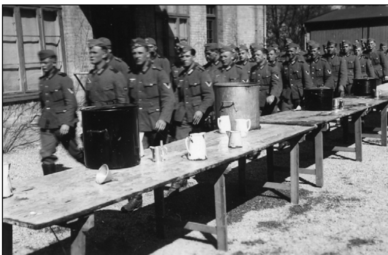
Tyske soldater marcherer ind til kaffe i gården på Vordingborg Kaserne

Skæbnen, som ramte enheder af hæren i Sønderjylland, var langt hårdere, idet at flere af disse enheder var involveret i direkte kamphandlinger mod tyskerne og havde tab flere steder. Man skal ikke blot have været soldat, men også have oplevet virkningen af regeringens ordre den 9. april, for helt at fatte hvor knusende og rystende den virkede. Da det meddeltes os, at vi var internerede på kasernen under tyske vagter indtil videre, følte vi, at alle vore strabadser og møje i vinterens løb havde været fuldstændig nytteløse og uden nogen som helst mening.