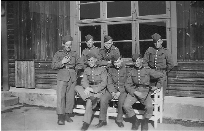
En gruppe soldater slapper af foran "Elefantbygningen" på Vordingborg Kaserne før det hele blev mere alvorligt

havne foretages der indskibning af tropper og materiel. Som følge heraf må det formodes, at et eller andet er i gære. Vi skulle derfor med øjeblikkelig virkning ligge alarmberedskab, hvilket vil sige, at vi skal være krigsklare til hurtig udrykning.