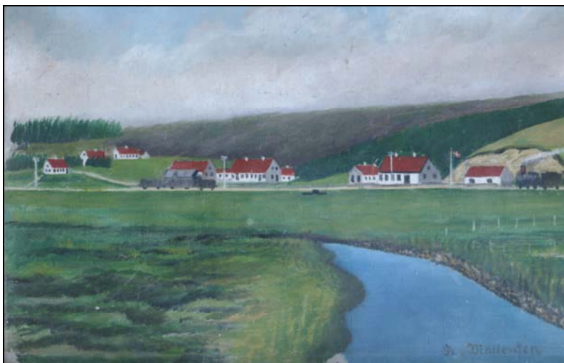
Halkær, hvor ”Skæg” blev hentet som lille hvalp

En gang, da far tilfældigvis traf på mølleren, forelagde han denne disse mærkværdigheder om hundens adfærd. Mølleren forklarede grinende sagens rette sammenhæng, om slagterens ugentlige slagtedag, om hundens gamle vane med at indfinde sig netop på denne dag. Her forekommer det mærkelige, at en hunds instinkt er i stand til at fortælle den, at det nu er dagen, den skal af sted efter føde. Også et klart bevis på, at en hund besidder visse egenskaber, som vi mennesker knap forstår rækkevidden af.