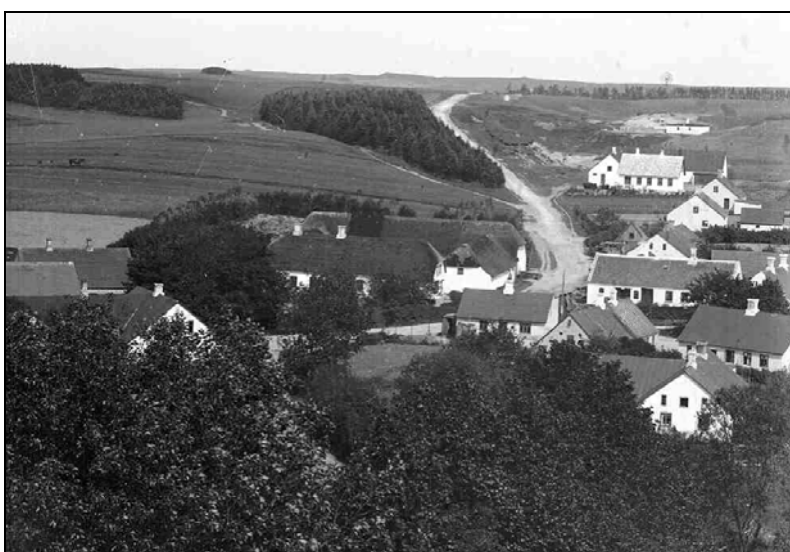
Drengene gik mod Guldbæk i stedet for at dreje til venstre ud mod Halvøen ad den skrå vej