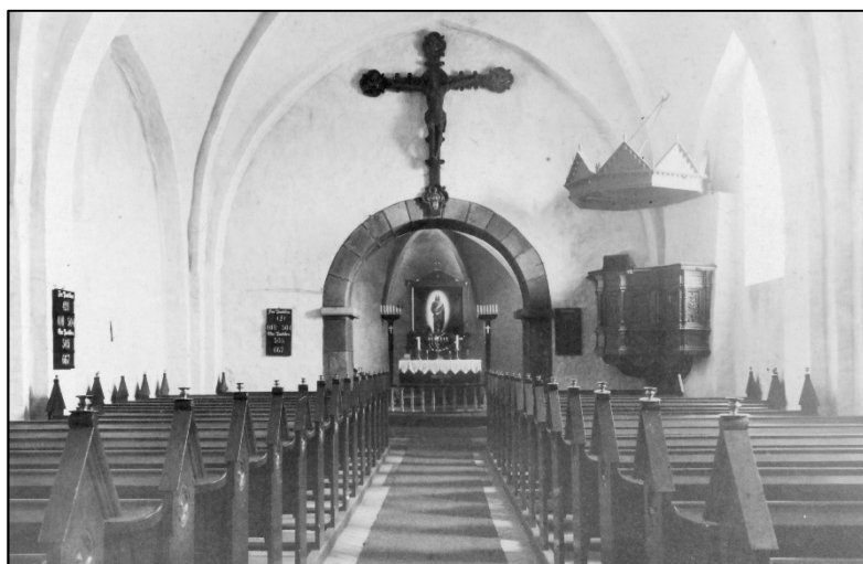
Før restaurering – bemærk prædikestolen i sydsiden

Nedenstående er et sammendrag af, hvad aviserne skrev. Der er ikke ændret i aviserens sprog. Opsætning og billedtekster: Niels Nørgaard Nielsen