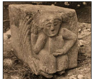
Hjørnестenen har siddet ved den nu tilmurede dør i sydsiden. Den er nu, sammen med en af søjlerne fra syddøren, placeret ved opgangen til prædikestolen

Tidlige så man tydeligt sporene af øksehug. Den var hugget til med økse af svære egeplanker.