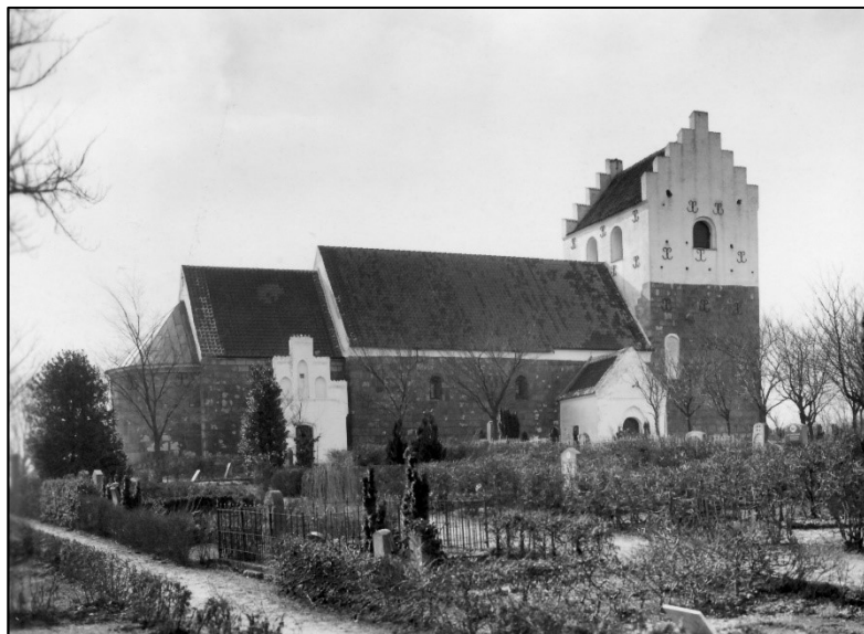
Øster Hornum Kirke kort efter 1938

I 1938 blev Øster Hornum Kirke gennemgribende restaureret.