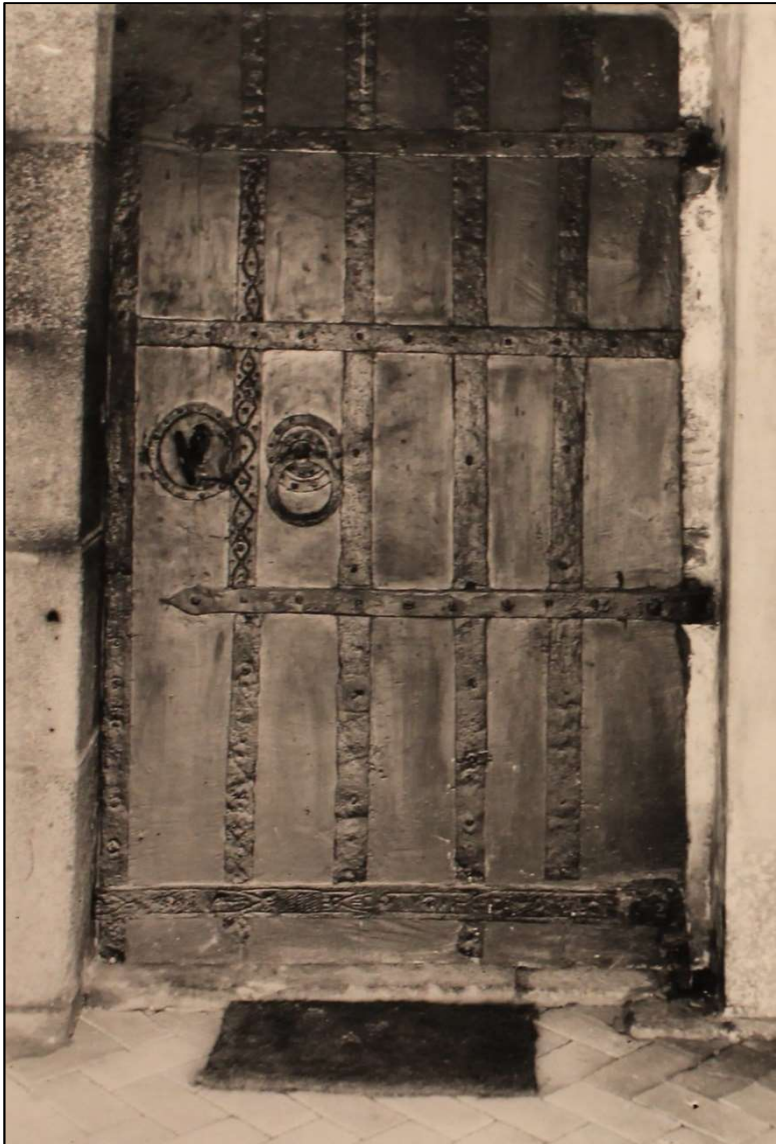
Kirkedøren før restaureringen – hvor den var placeret mellem våbenhuset og selve kirken

Desuden opdagede man, hvad der er en sjældenhed, at der havde været en stenbænk langs kirkesiderne inde i skibet. Her har kirkegængerne siddet i den ældste tid.