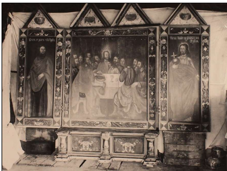
Altertavlen, der siden 1894 havde stået i tårnrummet sammen med redskaber og kul til kakkelovnene, ses her under restaureringen 1938

Disse ting har fået deres, antagelig, oprindelige farver.