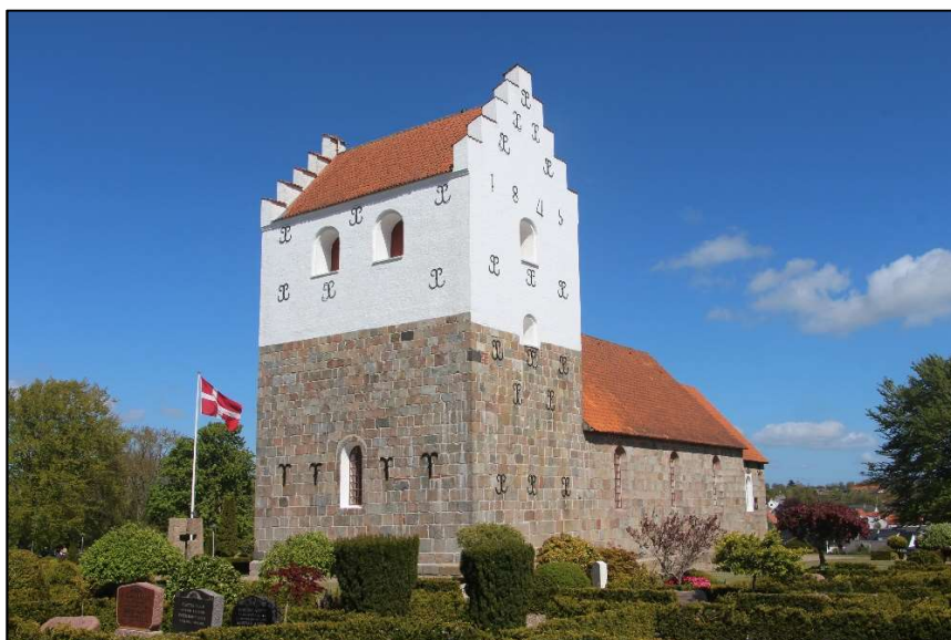
Øster Hornum Kirke foråret 2019

Derefter fik biskoppen ordet. Han fremhævede, at der var tale om en genåbning, ikke egentlig en indvielse af kirken. Derefter fremlagde han, hvorledes kirkerne ofte vanrøgtes og udtalte, at det jo efter hvad han havde set i dag, ikke er tilfældet her. Gid det heller ikke måtte blive det! Til sidst udtrykte lærer Thuesen sin glæde over den samling, der fra først til sidst havde været om denne sag og foreslog at synge "Kirken, den er et gammelt hus". Derefter meddelte formanden, at lysene nu ville blive tændt i kirken og adgangen til den være åben.