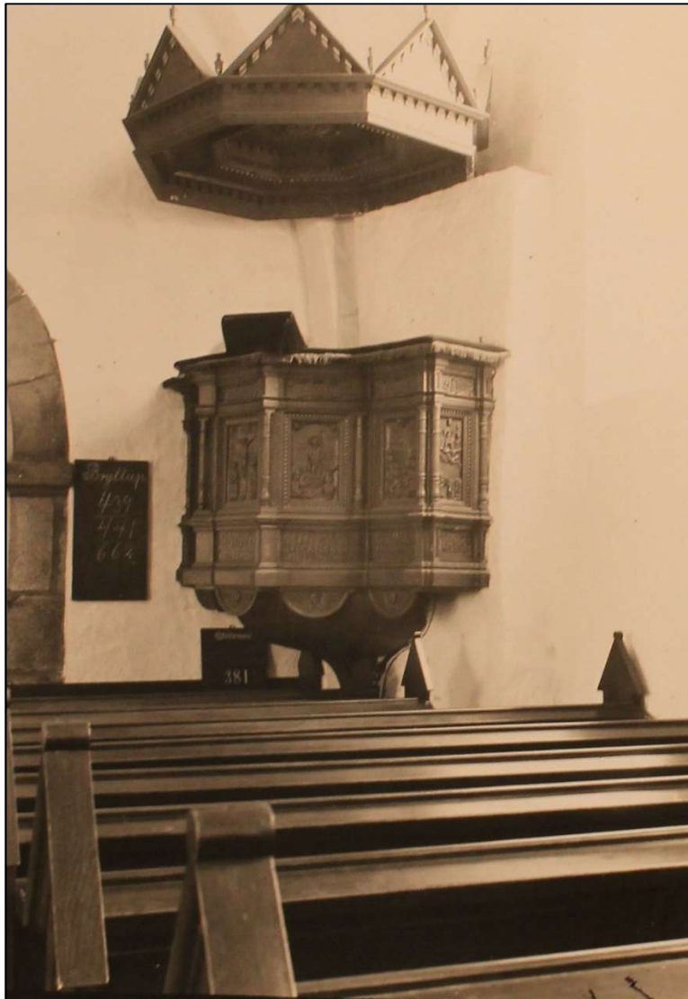
Prædikestolen før restaurering – i sydsiden og egetræsmalet på samme vis som bænkerne