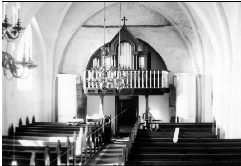
Kirkens orgel fra 1904 blev renoveret – først i 1955 blev det udskiftet med et nyt. Dette orgel, som man aldrig blev helt tilfreds med, holdt til 2004, hvor det nuværende orgel, der lever op til kirkens størrelse, blev indviet

Orglets ombygning er foretaget af orgelbygger Emil Nielsen, Esbjerg. Orglet er blevet smukkere, og tonerne er blevet langt fyldigere og klangfuldere end tidligere.