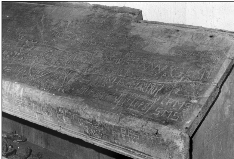
Degnestolen, hvoraf kun pulten er bevaret, med navne skåret med kniv – den står nu øverst i tårnet