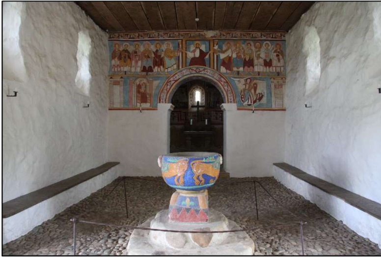
Bænke langs skibets sider – her kunne de gamle og svage- lige sidde under gudstjenesten. Her i kirken på Hjerl Hede