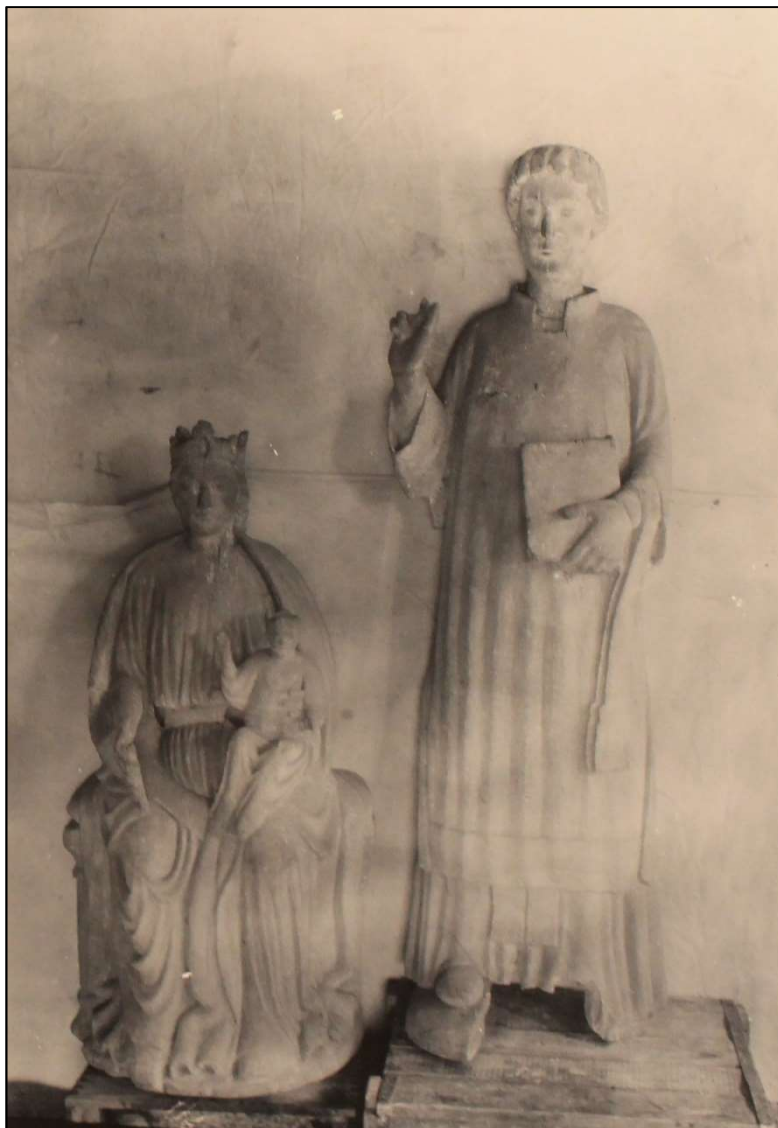
De to træfigurer da de var kalkede – måske for at de skulle se ud som var de hugget i marmor

I tårnet stod også den gamle degnestol, der har navne lige fra det 16. århundrede til vore dage. Navnene er skåret med kniv, nogle meget smukt, øjensynlig af degne, der har haft god til, måske på grund af de lange prædikener.