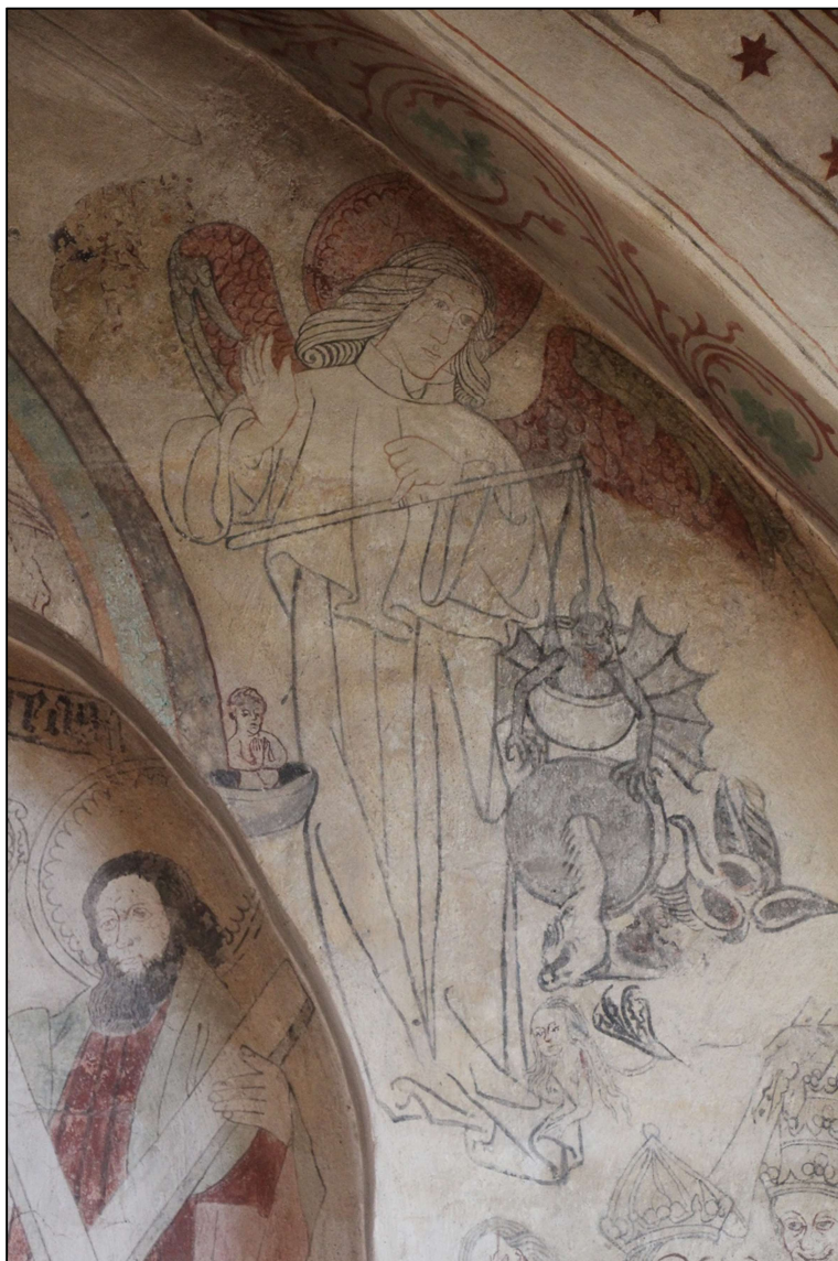
På dommedag bliver hver enkelt vejret – ham her ser det vist ikke for godt ud for – kalkmaleri i Jetsmark Kirke

og stadig udvikler den sig. Vi har fået den oplysning, vi så længe sukkede efter. Vi har fået teknik og mekanik, verdensudstillinger, der hedder ”Vi kan”. Men har vi nu også fået mere lykke af den grund? Har alle disse ting bragt os mere lykke? Nej, det har de ikke! Der er nemlig skyggesider også. Hvad er det nemlig, vi egentlig stiler efter? Selv om der er ædle anstrengelser imellem, så higer mennesket dog mod noget uvirkeligt, noget det egentlig slet ikke kan nå. Bestræbelserne er nemlig bygget uden om Guds evangelium.