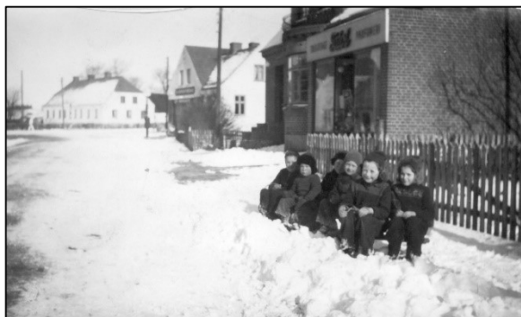
En flok børn på en stor kælkk ved Tatol