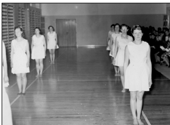
Her er det en flok kvindelige gymnaster til opvisning i skolens gymnastiksal omkring 1960