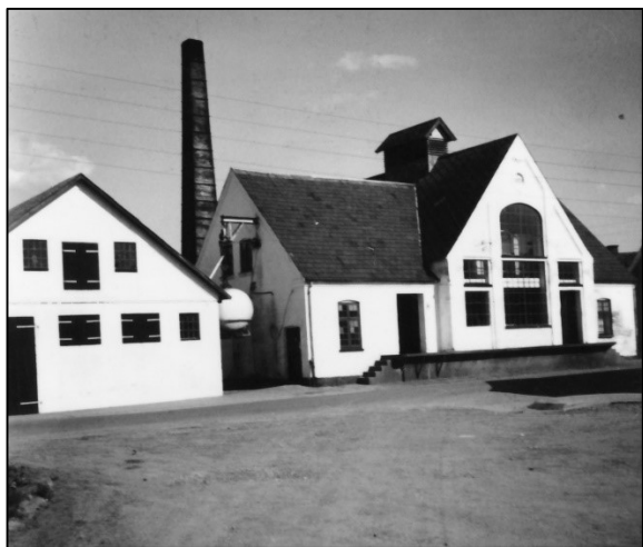
Mejeriet med stalden til venstre

ellers anede vores forældre ikke, hvad vi lavede. Der var en slags usynlig grænse for, hvad der gik an at foretage sig. Respekten for afstraffelse var tilstede.