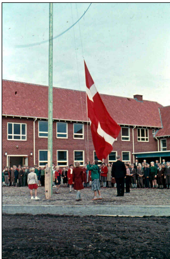
Skolen indvies, efteråret 1955

Der var flere vognmænd, som kørte med alt forefaldende. Vognmand Sørensen og sønnen Børge kørte fast med fulde smørdritler til Aalborg, og havde måske stenkul med tilbage til mejeriet eller bageren. Der var mulighed for at komme med på sådan en tur.