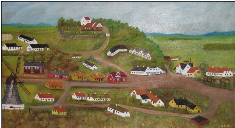
Øster Hornum omkring den tid, jeg blev født

Det var tilsyneladende et stort fremskridt med det nye kartoffelkøgeri, men tiden viste desværre noget andet. Hvert efterår ankom tusindvis af "tønder" kartofler til kogeriet, der næsten kørte i døgndrift. Kartofflerne blev læsset af i en stor betongrav, og via en snegl ført over i en vasker, hvor urenhederne blev skilt fra. Det gav naturligvis meget affald. Så blev kartoflerne ført op til toppen af de store tanke, hvor de blev dampkogt. Dampen kom fra mejeriets store dampkedel. De kogte kartofler gik så igennem en stor hakker og derfra direkte ned i landbrugsvognene. Det gav også kartoffelaffald. Affaldet blev skyllet ned i en stor betongrav, som holdt jord og fast materiale tilbage. Det overskydende vand blev ført ud i bækken. Beholderen blev tømt hver dag, og kartoffelaffaldet blev kørt ud på engen, som startede lige ved siden af kogeriet. Vandet, som naturligvis indeholdt kartoffelstivelse, havde en negativ virkning på bækken, og sammen med hele byens urensede kloakvand var det med til at ødelægge livet i bækken. Bækørreden her i den øverste del af Hasseris Å er aldrig kommet tilbage.