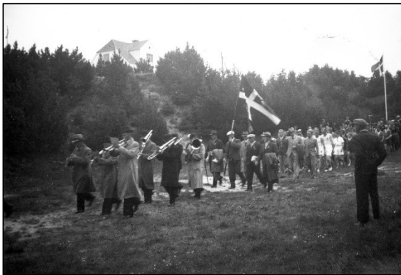
Hornorkester spiller i Sandgraven ved indvielsen af stadion 1940

Lige over for Svanedammen boede min bedste og bedstefar. Der kunne vi altid gå over for at få lidt varme ved bedste og få tørret de hjemmestrikkede vanter, som hun selv havde strikket, på kaminen (en finere form for kakkellovn). I det hus bor jeg selv i dag, og der er stadig en bedste i huset.