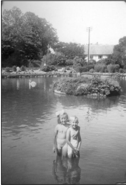
Badende børn i Svanedammen – mine bedsteforældre boede i huset i baggrunden

Om sommeren badede vi i dammen. Det var det mest sikre for mindre børn. Og så var det dejlig blødt at træde på bunden, der var fuld af svanelort. Det sundhedsmæssige var der ingen, der tænkte på. Når vi havde lært at cykle, måtte vi tage ud til Hornum Sø. Der var ingen forældreopsyn. Det tog ældre søskende sig af. I begyndelsen blev vi formanet om at ikke gå længere ud end til navlen. Jeg tror, der druknede et par stykker i min drengetid. Det var voksne mænd. Om søndagen kørte bageren ud til søen med brød og sodavand som han solgte.