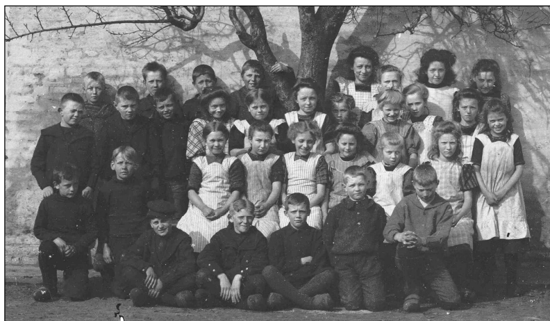
Elever fra Guldbæk Skole

Herfra tog vi til et pensionat, hvor børnene fik kaffe, Jensen og jeg middagsmad. Så gik turen ned til havnen, hvor der lå mange, dog ikke store, skibe. Med en damper sejlede vi til Marselisborg Skov. Fra bugten havde vi en fortrinlig udsigt over byen og prinsesslottet. Efter tilbagekomsten besøgte vi Domkirken, der ikke imponerede som Viborg, langt mindre som Roskilde. Den er måske højere, men forholdsvis tarvelig. Der er vældige piller, men kun faste siddepladser i midtskibet, og kun derfra kan prædikestolen ses. Selvfølgelig er der en del epitafier med mere. Den syvarmede guldløstestage (af messing) skulle være en efterligning af den i Jerusalems tempel.