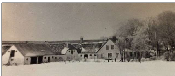
Sigsgaard ved juletid

Hvad angår juletræ kørte vi børn med far i bil til Hæsum, hvor der var en landmand med en lille skov, der havde jule- træer til at ligge på gårdspladsen. Dengang var det ikke brugt med at gå i skoven og fælde selv. Da jeg var lille, husker jeg, at det var mor og far, der pyntede juletræet. Juleforberedelser var der mange af.