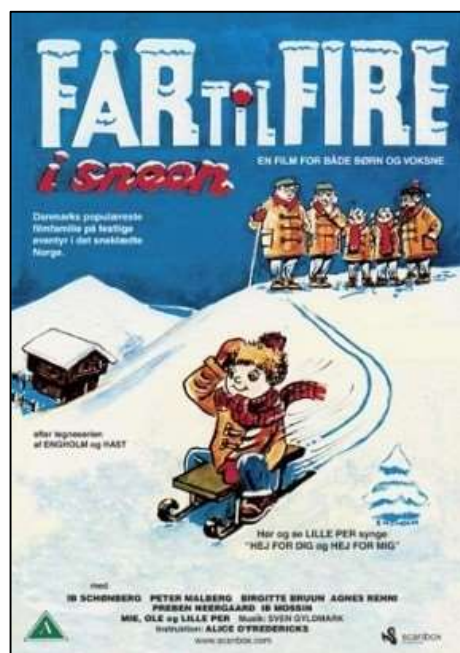
Far til fire i sneen

Endelig oprandt juleaften, og alle vi børn var i badekarret om eftermiddagen. Når far var færdig i stalden og havde malket, var vi alle glade og spændte, for nu skulle vi spise. Dengang var risalamande ikke moderne på landet. Så vi startede med risengrød og derefter gåsesteg. Det var ærgerligt, at der kun var to lår på en gås, for det var det kød, vi børn bedst kunne tygge.