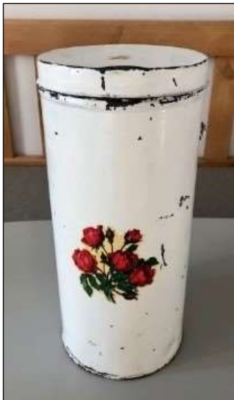
Familiens kagedåse gennem tre generationer

huske, hvad mor havde travlt med. Der blev bagt mange småkager til jul. Sådant en dag slap man for de daglige pligter i stalden og måtte være med hele dagen i et dejligt varmt køkken. Vi gik kun i skole hver anden dag. Det startede om morgenen med at fylde tørvekassen helt op med tørv, så der var brændsel til at fyre komfuret op med. Ovnens var i forbindelse med selve fyret, som også varmede vand til centralvarme i et kammer, badeværelse, soveværelse og to stuer. Det var en kæmpe varmtvandsbeholder, ja måske cirka 400 – 500 l, som lå på loftet.