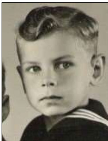
Gregers ca. 1948

Jeg er født 8 dage før jul, nemlig den 17. december 1942. Mit hjem var Sigsgaard, Nibevej 142. Jeg vil fortælle om jule- nen set med barneøjne.