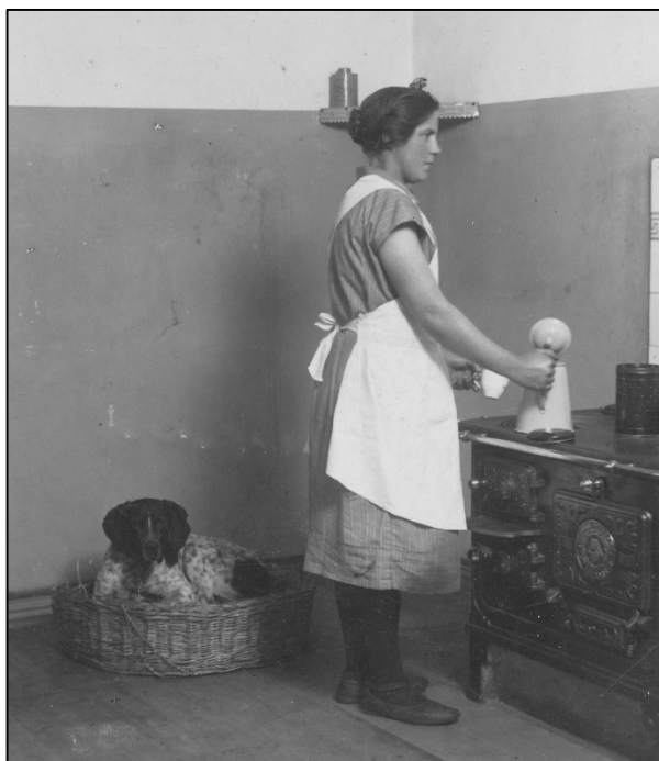
Kvinde ved brændselskomfur

I landbruget var det med at gøre så meget som muligt, så der var så lidt at lave i ju- ledagene. Det var med at få tærsket, så der var korn til grisene og halm til kø- erne, og selvfølgelig kørt roer ind, så roe- huset var fyldt.