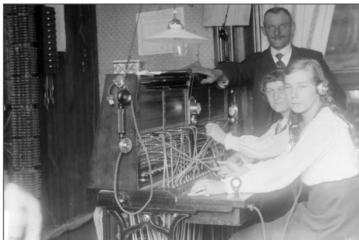
Telefoncentralen i Øster Hornum cirka 1940

fransk vask og strygning, og en var rullekone. Der var også to ishuse. Senere blev der bygget kommunekontor samt ansat en kæmner. Før den tid var det hjemme hos sognerådsmedlemmerne, at møderne blev afholdt. Der var et fint anlæg, Svanedammen, der var et yndet sted for os børn i middagspausen. Der var også Katbakken, et skovanlæg over sportspladsen og Sandgraven op ad bakken til Guldbæk. Det var en granskov med en stor plads inden i. Der blev blandt andet afholdt grundlovsmøder, og tivoli var der også gerne. Den eksisterer desværre ikke mere. Igennem byen løb der en bæk lige fra sportspladsen til præstens havedam, som dengang var en del større, med robåd og en bro ud til et lysthus i vandet.