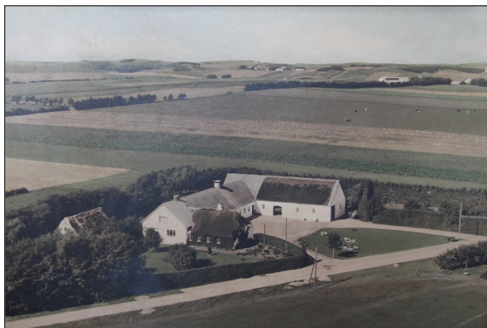
Staunholt i slutningen af 1940'erne