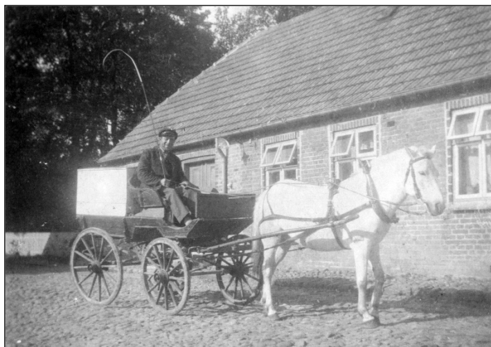
Handlende med varerne i en kasse på vognen

slagte, og kyllingesteg var jo altid godt. Det hændte også, at der pludselig kom en skrukhøne gående med nogle kyllinger, som en høne havde lagt et skjult sted. Når en høne begyndte med at skrukke, så blev hun slagtet eller lagt på nogle ande- eller gåseæg, som vi kunne købe andre steder. Hønseæggene samlede vi i en æggekasse fra Brugsen, og når den engang var fyldt, tog vi den med derned, hvor de så afregnede med brugsbogen. Æggene skulle helst kunne betale for varerne. I bogen noterede vi, hvad vi ønskede og sendte den med mælkekusken. Så kom han senere tilbage med varerne. Der var også en købmand på Tranten, hvor vi handlede rigtig meget.