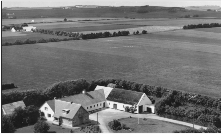
Staunholt med det nye stuehus

kaster faldt desværre på gulvet og brændte et mærke i det nye gulv til stor ærgrelse.