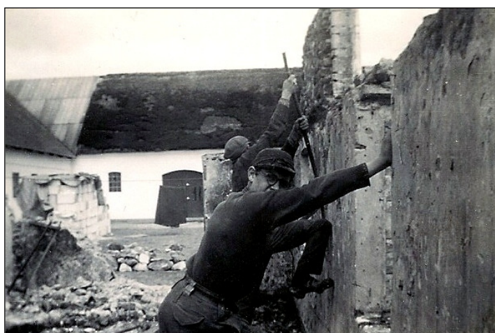
Det gamle stuehus brydes ned