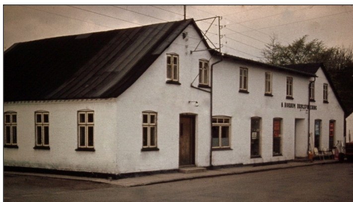
Brugsen i Øster Hornum