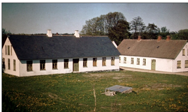
Skolen til venstre og lærerboligen til højre

Hvert forår, når markarbejdet var ovre, og inden der skulle tyndes roer, så skulle mine forældre ned i mosen og grave tørv. Det var jo vinterens brændsel. Det kunne dog strækkes med køb af kul eller koks, hvis vinteren blev for lang. Jeg har få gange været med nede i Sørup Mose. Alle gårde havde vist et lod i mosen dengang. Jeg husker med gru engang, vi skulle køre tørv i land, som det hed, at far ville køre over et sted, der så pænt fladt ud, men uha. Heste og vogn sank i til nav og mave. Det så træls ud, og nogen folk var så flinke at sige: ”Der kommer du aldrig fra”. Hestene blev spændt fra, og ved hjælp af andre heste og reb og brædder fik de sig moslet op. Vognen blev skilt ad og stump for stump bragt i land. Det blev en lang forestilling, men alt gik dog godt til sidst.