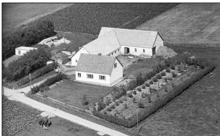
Ejendommen på Harrildvej 1948

skinner sammen med to naboer, da pengene var små. Derved kunne de klare sig med færre maskiner og også hjælpe hinanden.