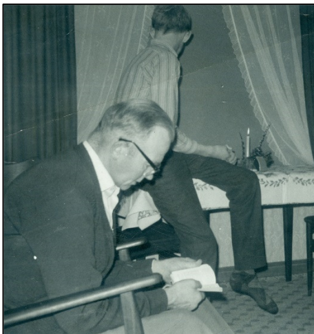
Far læser juleevangeliet

Julemiddagen bestod jo af andesteg med alt, hvad der til hører. Risalamande blev lavet som mor var vant til. Svesker i bunden, ovenpå risalamande og creme ovenpå. Desserten var pyntet med flødeskum. Der var jo også en mandel deri. Så vidt jeg husker, var mandelgaven en lille marcipangris.