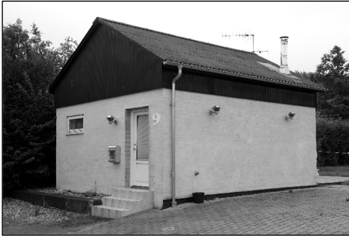
Frysehuset på Nihøjevej er for længst nedlagt og omdannet til privatbolig

En af juleforberedelserne var også når "julegrisen" skulle slagtes. Til at begynde med slagtede far selv grisen (han havde tidligere taget ud og slagte for andre). Dernæst skulle grisen parteres. Her hjalp vi alle hinanden. Vi børn fik de opgaver, som vi kunne klare.