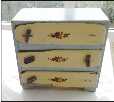
Det kunne også være, en lille kommode til småting, var årets bedste julegave

Tæt på julen lavede vi juledekorationer og hængte grangrene pyntet med glaskugler op på væggene. Grangrenene blev også pyntet med gips, som skulle forestille sne. Der blev også sat kravlenisser op. Der gik også meget tid med at klippe julepynt. Min mor og far pyntede juletræet, og det stod i den ”pæne” stue, indtil juleaften oprandt. Mor lavede adventskransen. Det var højtideligt, når lysene blev tændt, og vi sad i den hyggelige stue og sang adventssalmerne.