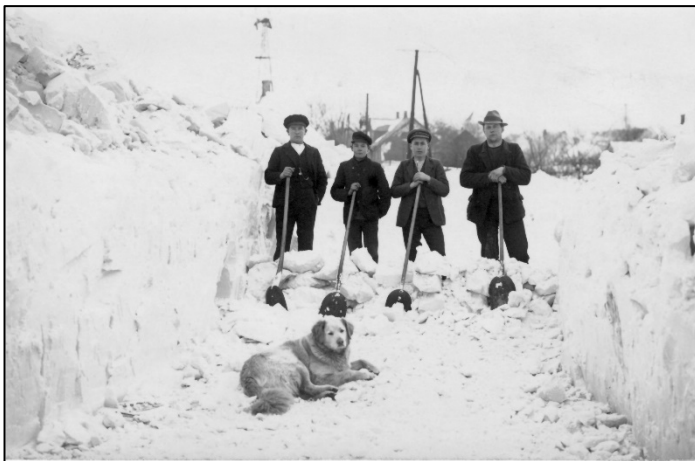
Der var altid meget mere sne i barndomstiden – her en flok snekastere i gang med at rydde vejen

I juledagene hyggede vi os derhjemme og med gæster. Vi var også på besøg hos familie. 5. juledag var vi til juletræ i Moldbjerg Missionshus. Her mødtes vi med alle dem, som vi kendte. Der var et stort juletræ, som gik helt til loftet. Vi var i flot tøj, mor syede som regel julekjolen til mig. Vi dansede om juletræ, sang og legede omkring træet, det var sanglege som f.eks. ”Nu går vi rundt om en enebærbusk”, og ”På loftet sidder nissen med sin julegrød”, samt mange andre. Vi fik også en slikpose. Der var endvidere kaffe og hjemmebag.