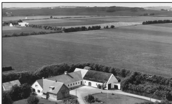
Staunholt, Gl. Viborgvej