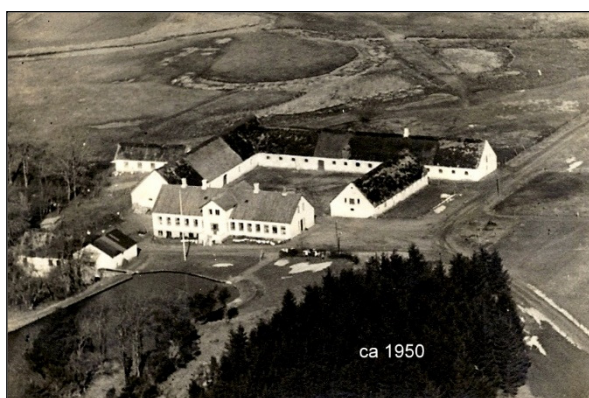
Hyldal Mølle cirka 1950