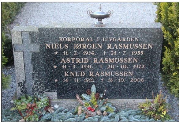
Gravstenen på Øster Hornum Kirkegård, hvor nu også forældrene er begravet

Han fik en flot begravelse. Far og mor syntes, at han skulle en tur hjem først, så om aftenen før begravelsen hentede vi ham i kapellet på sygehuset. Hele familien var alle sammen med. Det var med åben kiste. Alle sygeplejerskerne fra afdelingen og dem, som kendte ham, kom og sang ham ud. Hjemme havde vi lavet et lille kapel, pyntet med gran, lys og flag i bilgaragen.