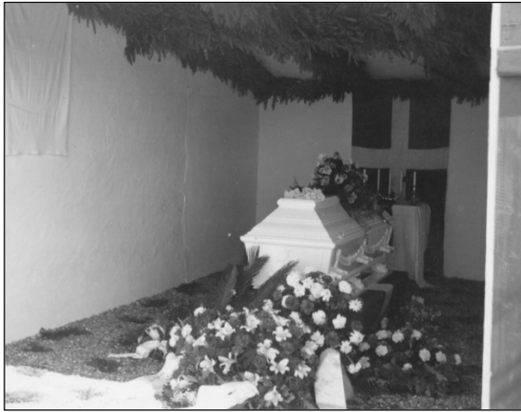
Kisten i den gransmykkede garage

planlagde, at når forårsarbejdet var ovre, så skulle han hjem igen. Han var jo bare tyve år og længtes. Men det blev i en kiste.