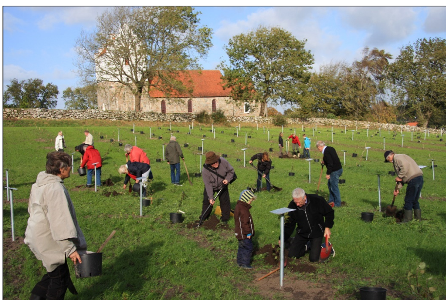
Mange var mødt frem til plantedag 2011