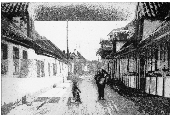
Trommeslageren i en af Nibes smalle gader

De fleste byer og egne har hver sine særprægede mennesker. Nogen mere end andre, men fælles for dem alle er, at de på en eller anden måde bemærker sig mere end andre. Lige som min hjemegn har sine, så havde Nibe også den gang nogle af slagsen.