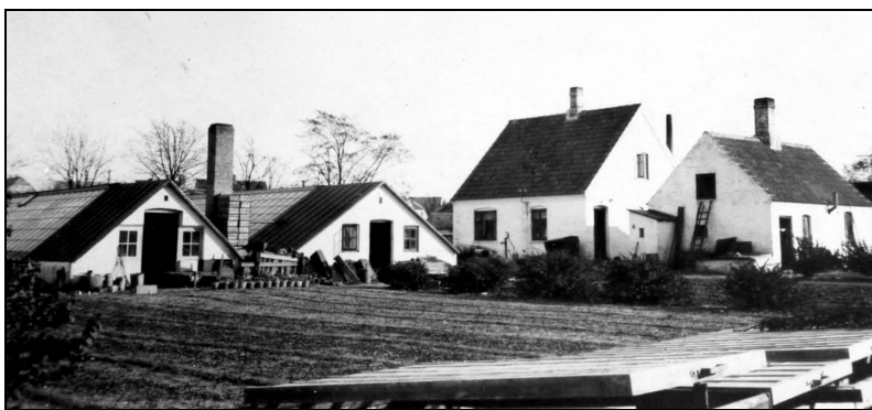
Gartneriet med drivhuse, mistbænke, friland og beboelse

Nå, mens jeg skriver dette, mere end fyrre år efter, så er jeg ikke i tvivl om, at det valg jeg traf hin forårsdag for så mange år siden var det rigtige. I modsat fald ville jeg måske ikke i dag have oplevet at komme til at kende og have haft med så mange mennesker at gøre, både syge og raske, som tilfældet er.