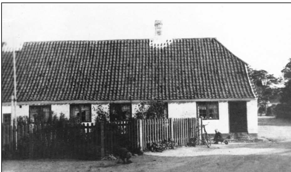
Nibe Fattig- og Svendehjem