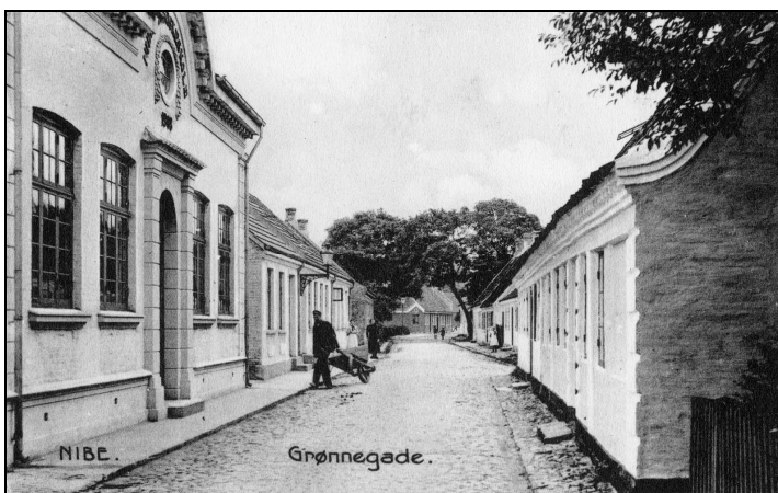
Teknisk Skole i Grønnegade

I efterårets skumring blev en af os somme tider sendt af sted med en trækvogn til kirkegårdens affaldsgrube, hvor vi samlede alle de bortkastede krans sammen og kørte dem hjem i gartneriet. På regnvejrsdage og mørke aftener, hvor vi ikke kunne lave andet, blev vi sat til at afmontere kransene, så bøjlerne kunne anvendes til nyt binderi ind mod jul. Grunden til at denne transport skulle foregå i aftenskumringen var, at kunderne ikke måtte se, at dele af de købte krans havde tidligere været brugt.