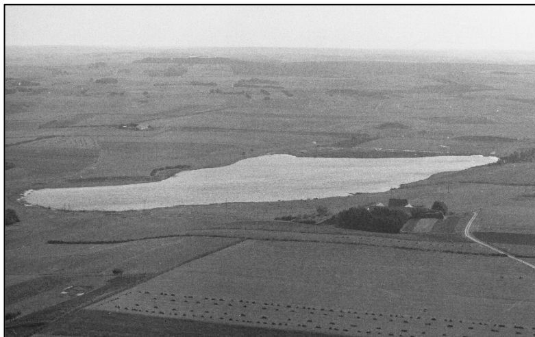
Hornum Sø, begyndelsen af 1950'erne

Endvidere var der fyringen af drivhusene, som også gik på skift om søndagen samt den sidste fyring om aftenen klokken cirka 22. Så vidt jeg husker, var der tre eller fire ret store kedler til opvarmning af drivhusene, som alle var koksfyrede. Om vinteren skulle fyringsvagten begynde på fyringen klokken 6 og var først færdig ved arbejdstids begyndelse klokken 7. Disse vagtsøndage og fyringsvagter indgik som et naturligt led i læretid og uddannelse og blev på ingen måde honoreret ekstra med penge eller fritid, men udelukkende betragtet som gartnerlevens pligt ud over normal arbejdstid.