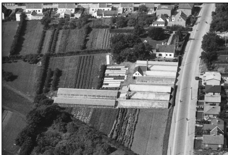
Houmøllers gartneri, Hadsundvej 86, slutningen af 1940'erne