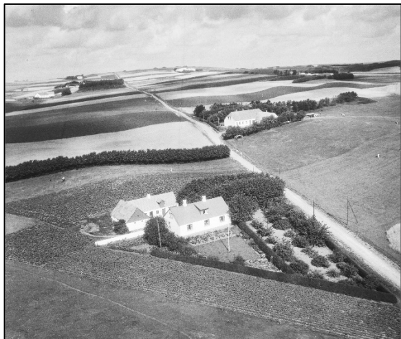
Hjemmet på Nihøjevej, foto Kgl. Bibliotek 1952

årligt, allerhøjest to, årlige besøg i hjemstavnen og hjembyen Øster Hornum. Det længste af disse besøg var vel nok den årlige sommerferie på cirka en uge, men et par gange blev det til en smuttur i påske eller pinse på et par dage. Disse hjemlige besøg var noget, at man så hen til med glæde og forventning lang tid i forvejen. Rejseruten var altid den samme, idet man anbragte sine pakkenelliker på cyklens bagagebærer og startede ind mod Københavns havn, nærmere betegnet Kvæsthusbroen, hvor D. F. D. S'. rutebåde til Aalborg lå.