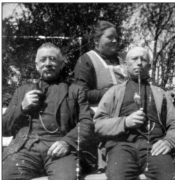
Et par herrer ryger "lang pibe", mens "vormor" i baggrunden serverer kaffe i haven

afviste enhver anden, der forsøgte sig som hundedressør. Den kunne også lukke døre op, og morede sig åbenbart ved altid at løbe i forvejen og lukke døre op inden at Houmøller nåede frem. Dog skal det ikke nægtes at malingen omkring dørhåndtagene bar tydeligt præg af denne sport.