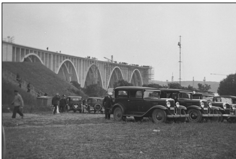
Allerede mens Lillebæltsbroen var under opførelse, var den et velbesøgt udflugtsmål