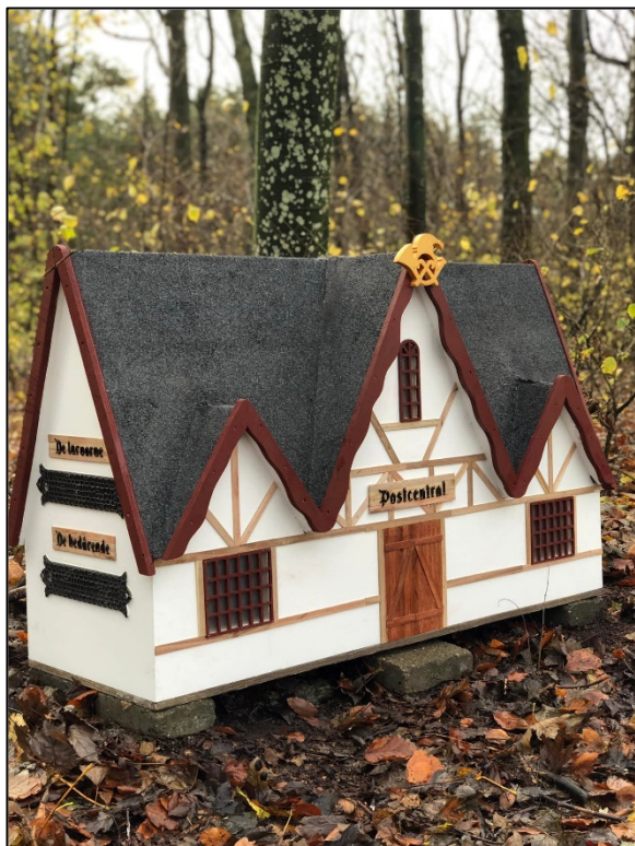
Nisse-postcentralen med de fire brevsprækker: En til de artige, en til de uartige, en til de lurvarne og en til de bedårende