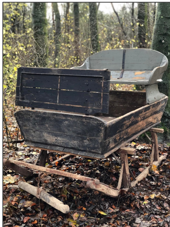
Kanen står klar til at fragte alle børnenes breve til julemanden. Julemandens rensdyr Rudolf og Randi bliver en sen nat spændt for kanen – og så går det afsted til Julemanden

De første år familien boede på Katbakken havde Nissemor Rødhat og Nissefar Rødhat opstillet en stor postkasse i skoven. Her kunne alle børn aflevere deres breve til julemanden. Den var snart alt for lille, da der kom mange hundrede breve, så i de senere år, og altså også i år, har de bygget nisse-postcentral, hvor børnene kan aflevere breve med julegaveønsker til julemanden. Der er i nisse-postcentralen fire brevsprækker, hvor der kan postes breve: En til de artige, en til de uartige, en til de lurvarne og en til de bedårende. Ved nisse-postcentralen er der allerede nu ankommet den julekane, som til jul fragter alle brevene til julemanden.