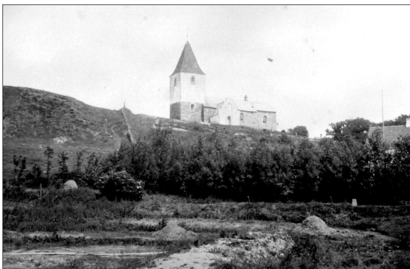
Ældst kendte foto af Gravlev Kirke med Klokbakken til venstre

Han styrtede ud med stokken. Denne gang skulle der ikke tages smålige forretningshensyn. Nu skulle der statueres et eksempel. Om der så røg både bowser og vest og måske frakke oven i købet.