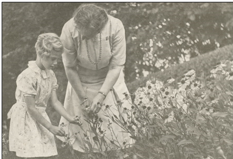
Elisabeth og Alexandrine ved nogle af parkens blomster

Lille prinsesse Elisabeth, den ældste af prins Knuds børn, kørte rundt i gartneriet på sin trehjulede cykel, men altid ledsaget af moderen Caroline Mathilde eller dronningen. De to drenge var endnu ikke ankommet. Prins Knud med familie havde fast ophold i slottets kavalerfløj, fløjen til højre for indkørselen. Hustruen Caroline Mathilde var datter af prins Harald, en bror til kong Christian, og prinsesse Helena fra Tyskland. Prins Knud var en hyppig gæst i