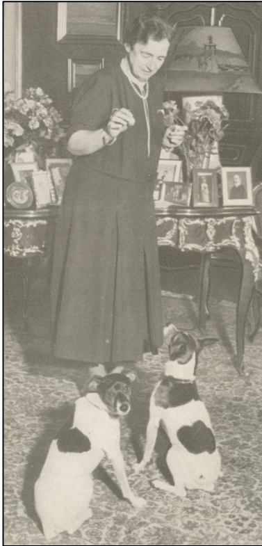
Alexandrine med sine hunde

Som følge af mit arbejde kom jeg ofte kongefamilien på nært hold. Prins Knud var nok vor hyppigste kunde, eller gæst, som vel nok i nogen grad skyldtes hans store interesse for fugle. I forretningen fandtes en meget stort fuglevoliere med mange forskellige arter stuefugle, som prins Knud i øvrig kom og tilså, og samtidig få en lille "fuglesludder". Prins Knud var selv en interesseret dueopdrætter med mange brevduer, som deltog i kapflyvninger i ind- og udland. Han interesse strakte sig også over almindelige husdyr som geder, fjerkræ, hunde, ponyer med mere som færdedes rundt i parken omkring slottet. Denne interesse delte han i øvrigt med sin mor dronning Alexandrine, som foruden en del høns også havde et par foxterrier hunde.