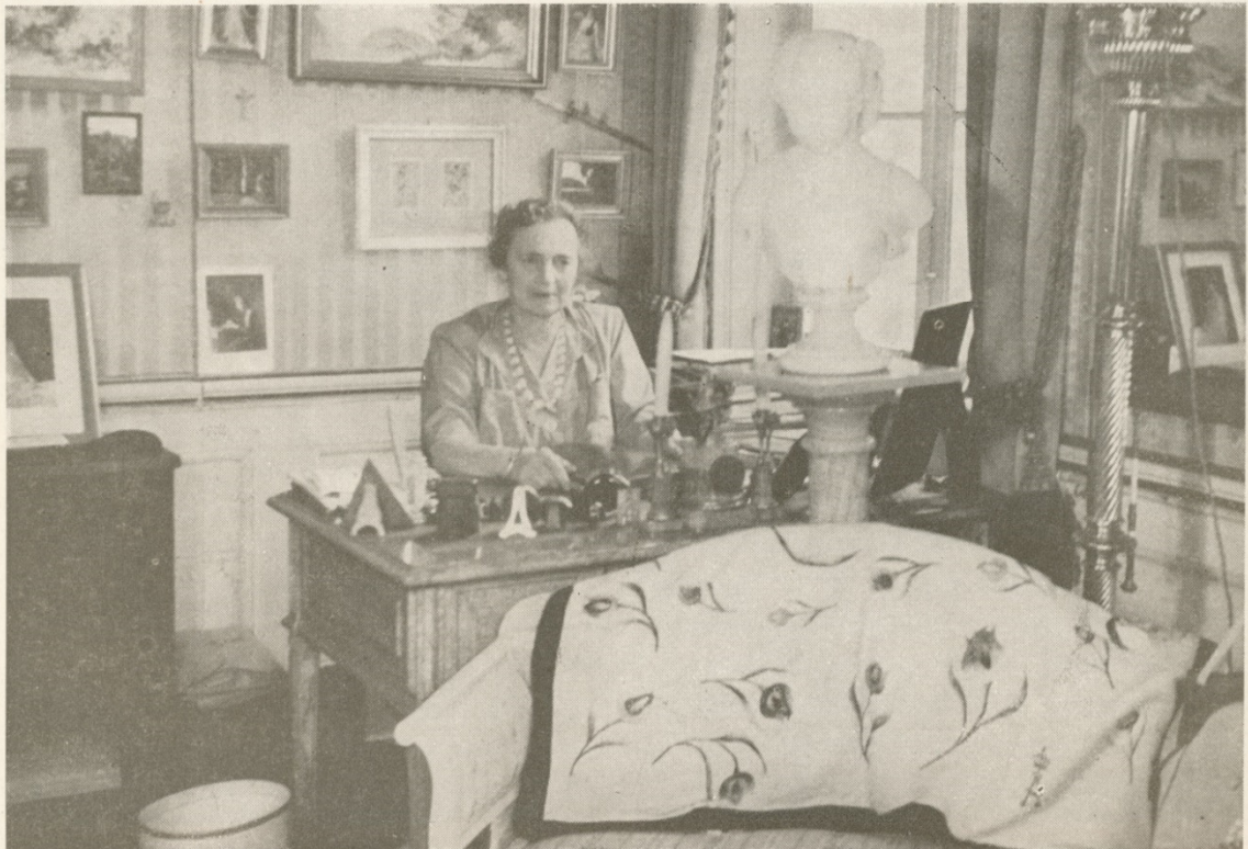
Her er Dronningens Arbejdsværelse. Hvert eneste Billede, hver eneste Nipsting gemmer paa et eller andet personligt Minde for Dronningen

Opslag fra bogen "Folkets Dronning Alexandrine", forlaget Dana, udgivet 1949 ved hendes 80-års dag. Fra denne bog er øvrige billeder om og med Alexandrine taget