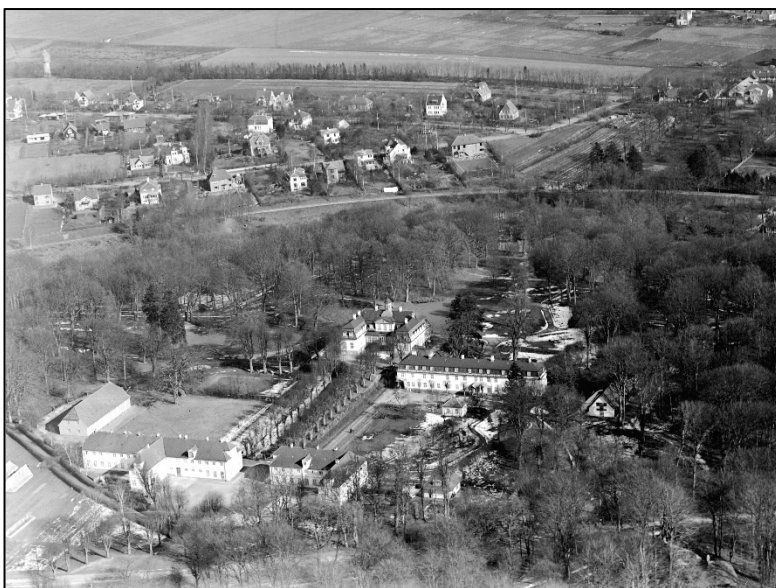
Sorgenfri Slot, foto Kgl. Bibliotek 1935. Gartneriet anes i nederste venstre hjørne

Ved en anden lejlighed indfandt dronningen, eller "Drine", som hun kaldtes i daglig tale, i forretningen, hvor der stod en spand fyldt med nelliker. Dronningen spurgte om prisen pr. stk. og fik opgivet dem alle. "Tak, jeg tager dem alle", var svaret. Det var vel ikke så mærkeligt, at der altid opstod en indbyrdes kamp om at komme først, når "Drine" skulle ekspederes i forretningen.