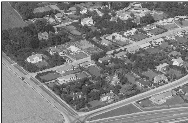
Hulbergs gartneri ses på dette foto, Kgl. Bibliotek 1956, lidt til venstre for midten

En skelsættende begivenhed i min læretid som gartner indtraf den 1. august 1937, idet jeg da tiltrådte min sidste læreplads som elev på Sorgenfri Slotsgartneri i Lyngby. Måske har det været en af de lykkeligste tilfældigheder, som af uforklarlige grunde spillede ind i min tilværelse, at det blev på Sorgenfri, min læretid af skulle afsluttes.