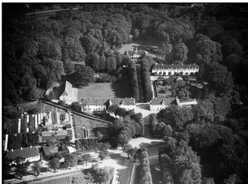
Sorgenfri Slot med slotsgartneriet nederst til venstre, foto Kgl. Bibliotek, ca. 1938

Nogle dage efter pakkede jeg kufferten, som det hedder, og rejste en tur til Øster Hornum for at holde et par dages ferie hos mine forældre. Derefter gik turen tilbage med damperen "Aalborg" til København. Men denne gang til en lykkeligere og lærerig tilværelse på Sorgenfri, som varede de næste knap to år. Jeg drog derfra som udlært gartnermedhjælper med aflagt prøve og diverse beviser.