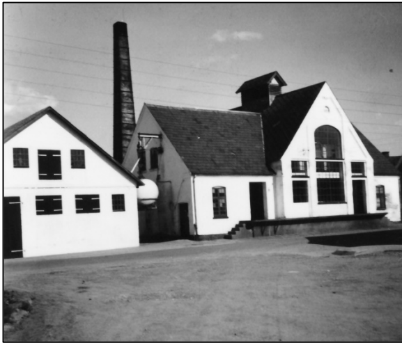
Andelsmejeriet, foto 1958

Det gamle mejeri var efterhånden slidt, så der blev bygget et nyt i 1962-63. Der blev installeret et transportbånd til spande, samtidig blev der bygget et stort kogeriet til kartofler nede bag ved mejeriet.