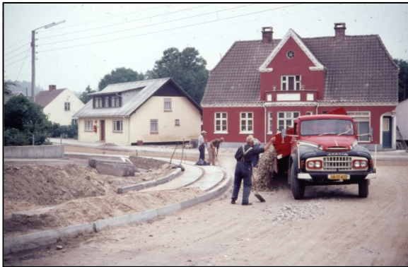
Fra venstre Nibevej 181, 183 og 185, foto ca. 1970

Byens Tatol, som havde det meste af, hvad kvinder manglede. Desuden havde de også salg af tipskuponer. Senere blev det solgt, og der blev en bodega på stedet. Nu er det en af byens frisører, der har salon.