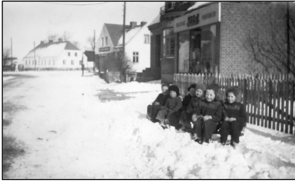
En flok børn på en stor kælk foran Tatol, foto ca. 1950