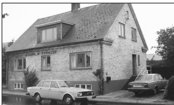
Kommunekontoret, foto 1973