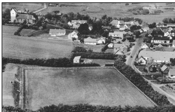
Stadion 1956, Øster Hornum i baggrunden