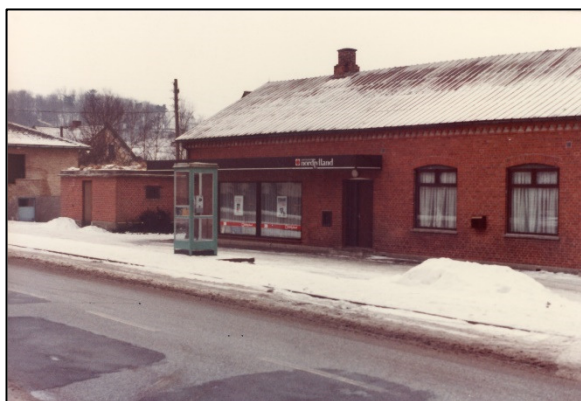
Forsamlingshuset med sparakassen, foto ca. 1978