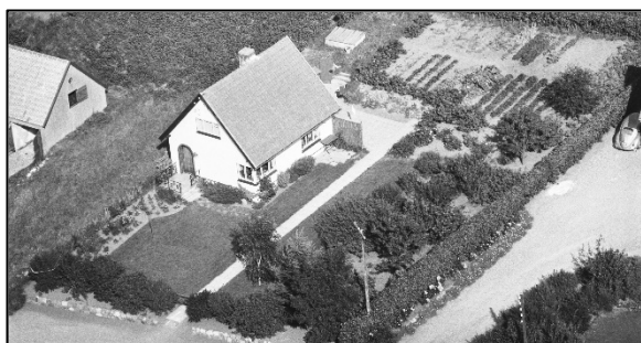
Nibevej 158