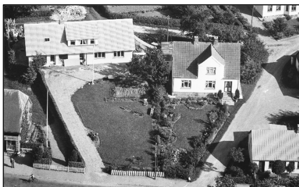
Nibevej 178, Nibevej 176 og yderst til højre Nibevej 174