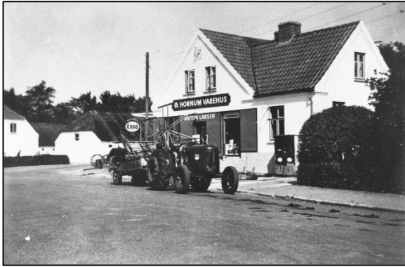
Øster Hornum Varehus, foto 1949