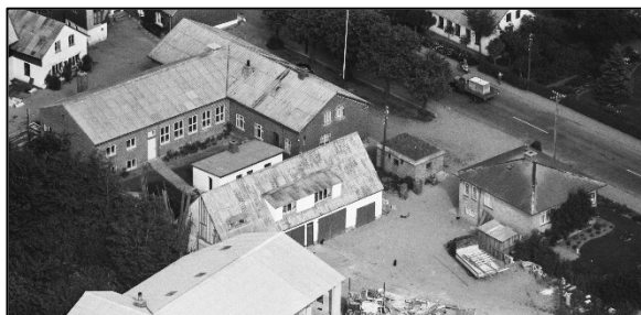
Forsamlingshus og Nibevej 173