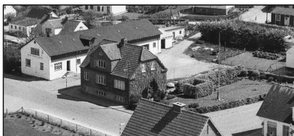
Haases Gård; Nibevej 172 anes over lagerets tag