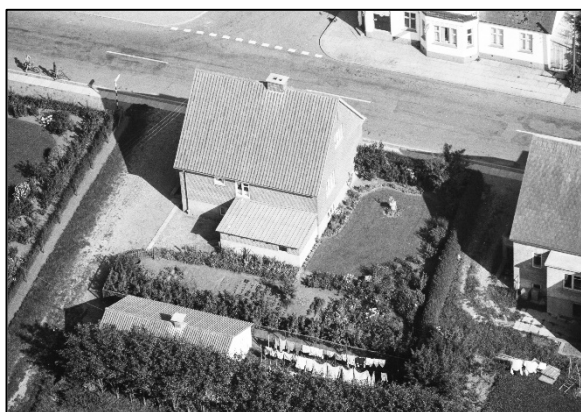
Dalbo med andelsvaskeriet i forgrunden