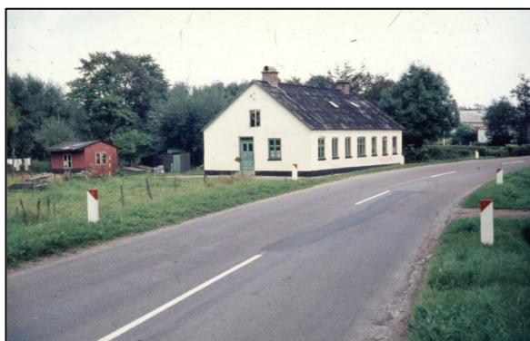
Kommunehuset, foto 1964