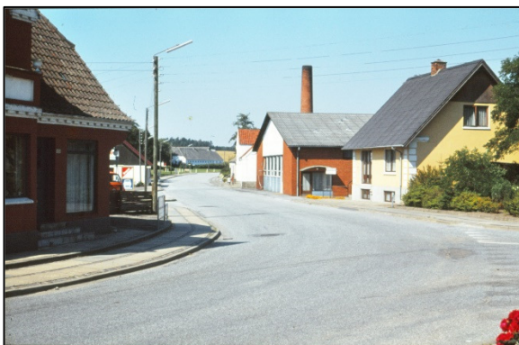
Fra højre håndkøbsudsalg, derefter mejeriet, foto 1980

Det var Brugsen som startede 1889. Den brugs der er nu, blev bygget først i 60'erne. Uddeleren var den navnkundige Kjøbsted.