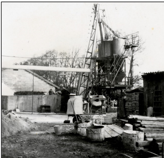
Kartoffelkogeriet, foto 1957

I hjørnet af mejeriet, over mod skomageren, var der mejeriudsalg. På det tidspunkt kunne gravide få mærker udleveret, så de kunne hente mælk. Så var det ingen hemmelighed mere, hvem der ventede småfolk.