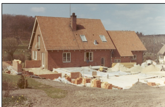
Der bygges tandklinik 1971

Huset blev bygget omkring 1954 og blev byens lægehus.